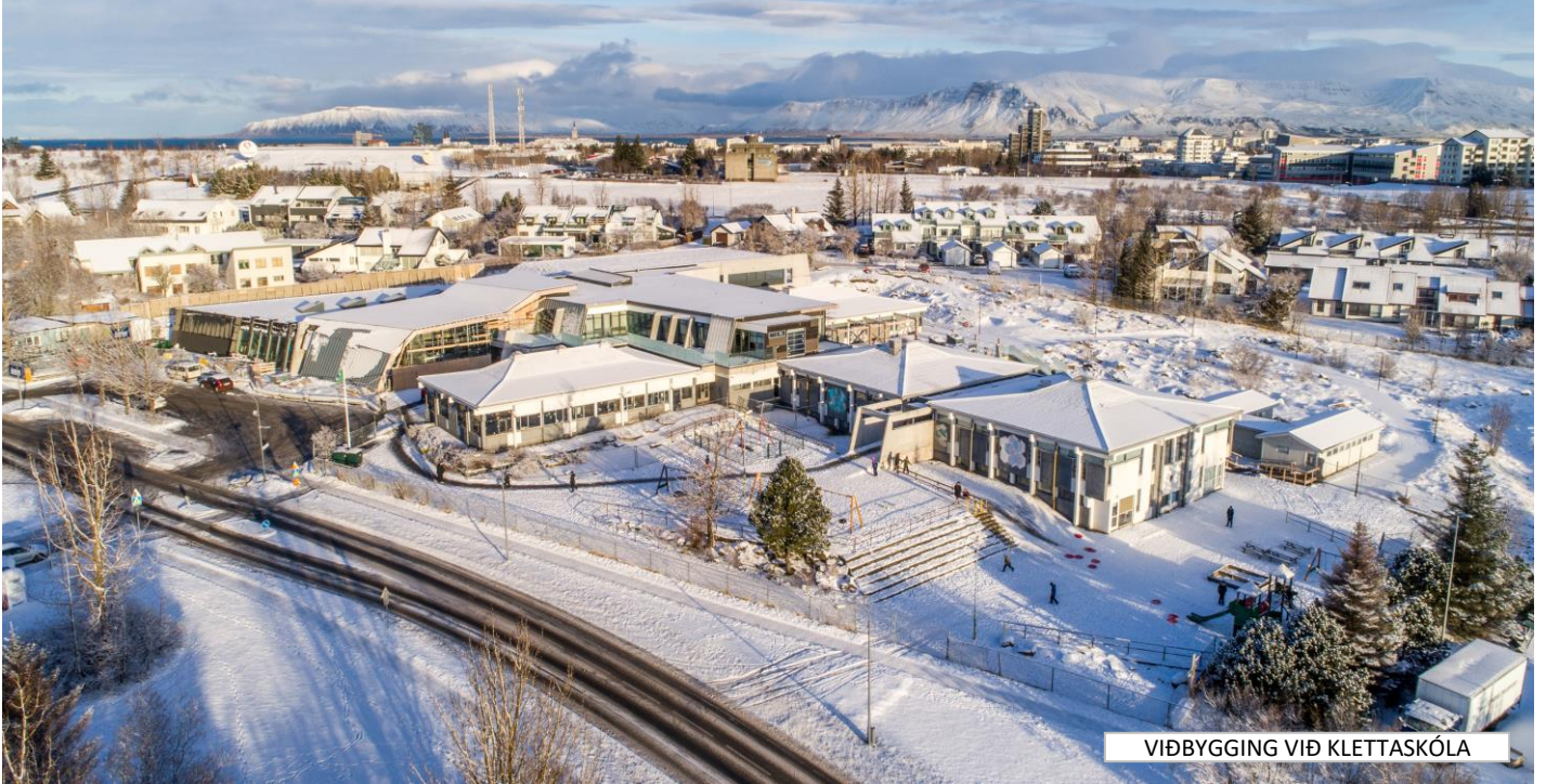
VIÐBYGGING VIÐ KLETTASKÓLA