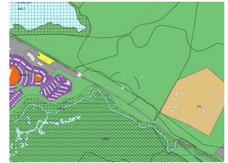
ADALSKIPULAG REYKJAVÍKUR 2010-2030

Birt í B-deild Stjórnartíðinda þann _____ 20_____.