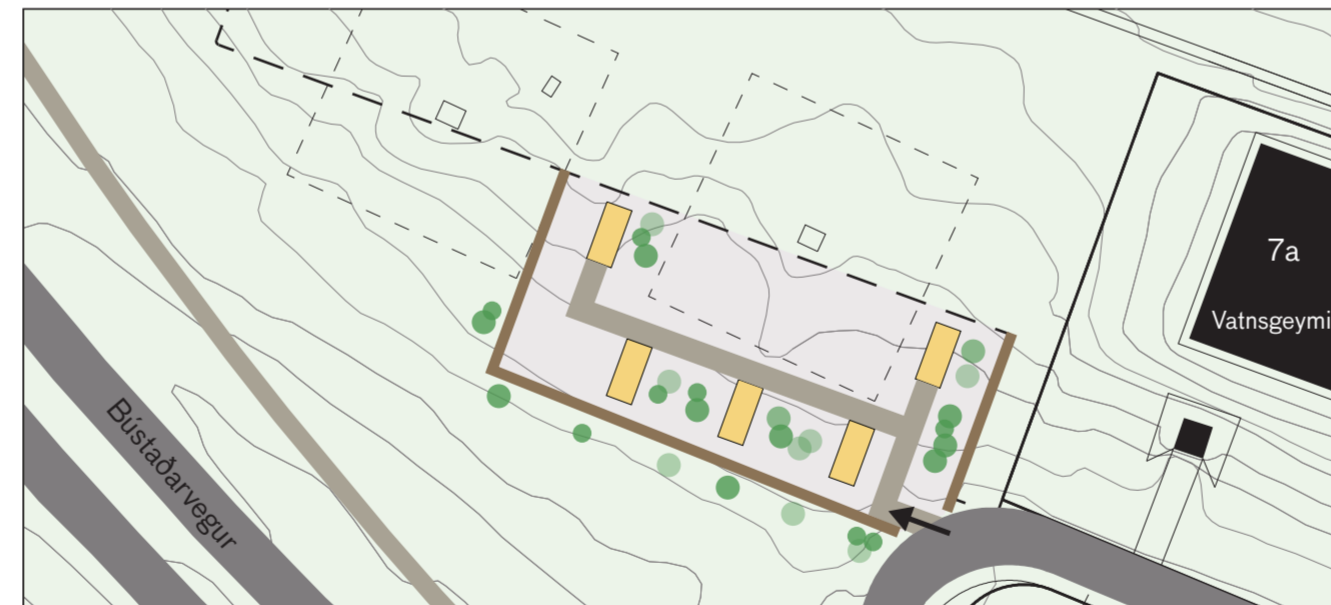
SKÝRINGARMYND 1:1000 (tillaga að fyrirkomulagi húsa)

Gert er ráð fyrir allt að 5 smáhýsum á lóðinni. Húsin eru allt að 35m 2 að stærð en auk þess er heimilt að gera skyggni yfir inngöngum.