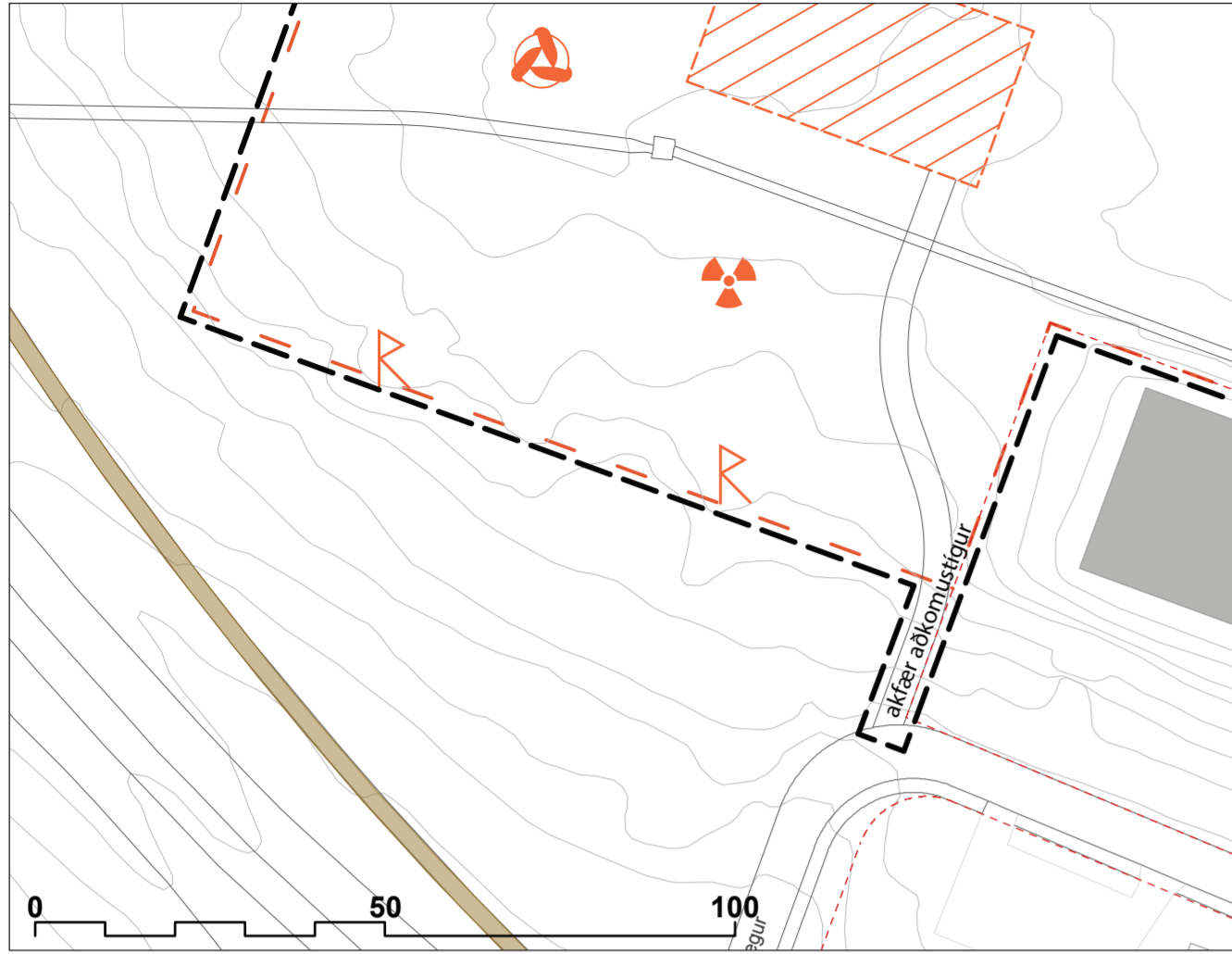
VEÐURSTOFUHÆÐ -NÝR MÆLIREITUR, Kanon arkitektar, dags. 07/02/2019 GILDANDI DEILISKIPULAG 1:1000