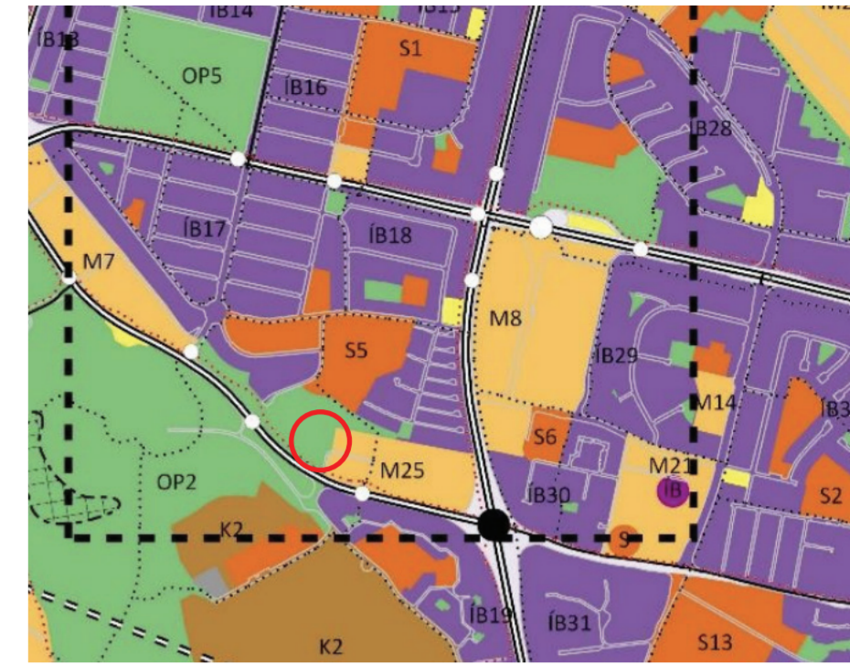
Úr Aðalskipulagi Reykjavíkur 2010-2030

Lýsing deiliskipulagstillögu Á mæltreitnum eru stundaðar langtíamælingar Veðurstofunnar, en reiturinn er jafnframt notaður sem tilraunareitur til mælitæknilegra rannsókna. Geislavarnir ríkisins eru einnig með aðstöðu fyrir mæla á svæðinu. Reiturinn verður girtur af með mannheldri, gagnsærri girðinu og læsanlegu hliði. Helgunarsvæðið verður ekki afgrit og nýtist sem fyrr sem almennt útivistarsvæði sbr. landnotkun núgildandi aðalskipulags. Ekki skal gera ráð fyrir háum trjágróðri á helgunarsvæðinu. Almenn gildir að byggingar eða önnur mannvirki mega ekki skyggja á reitinn.