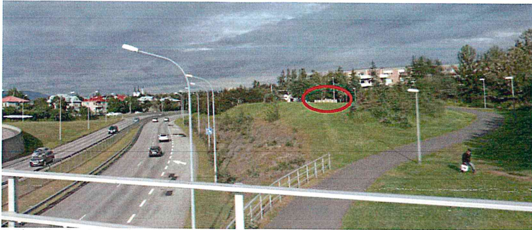
Fyrirhuguð staðsetning tveggja smáhýsa, séð frá Bústaðavegi