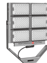
Performance iN Lighting Laser+