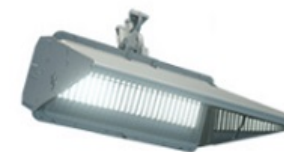
Musco Sports Lighting TLC-LED