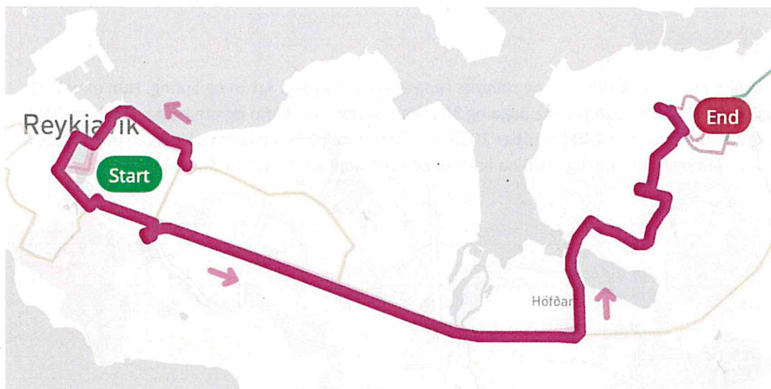
Akstursleið án Gullengis, Skólavegs og Mosavegs