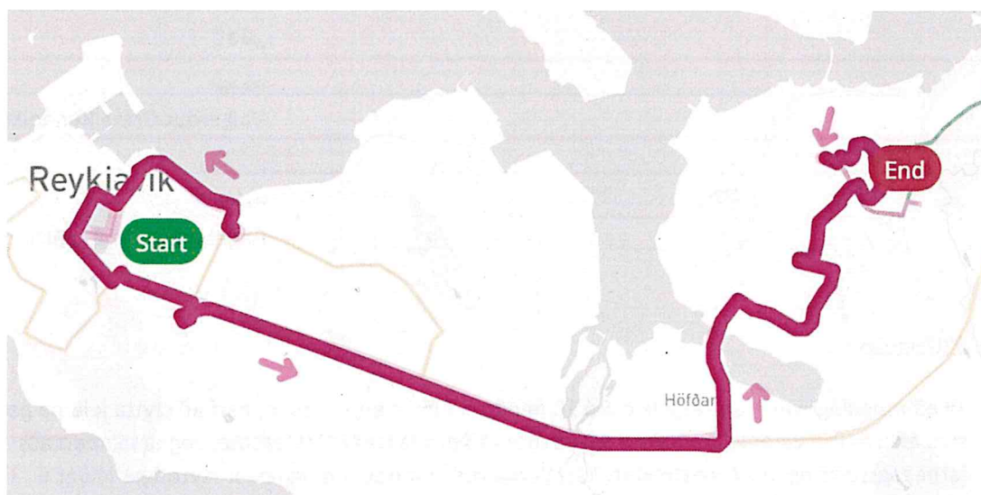
Óbreytt akstursleið frá í dag, að Spöng.