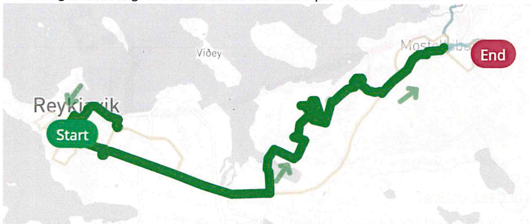
Akstursleið leiðar 6 í dag.

Leið 6 ekur á milli Hlemms og Háholts í gegnum Lækjartorg, Ártún og Spöng. Hún ekur á 15 mínútna tíðni á daginn virka daga og 30 mínútna tíðni á kvöldin og um helgar. Farþegafjöldi leiðarinnar var 112.240 í október 2015 skv. farþegatalningu og hafði þá fjölgað um 4,81 % á milli ára og hvert innstig í leiðina kostaði að meðaltali u.þ.b. 370 kr árið 2015.