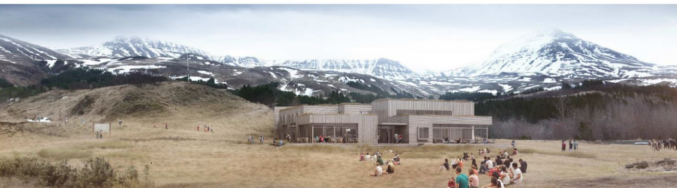
Skýringarmynd sem sýnir tillögu að fyrirhuguðu hóteli og þjónustumiðstöð, séð úr suðvestri.

Að öðru leyti gilda eldri skilmálar skv. deiliskipulagi frá 2002 m.s.br.