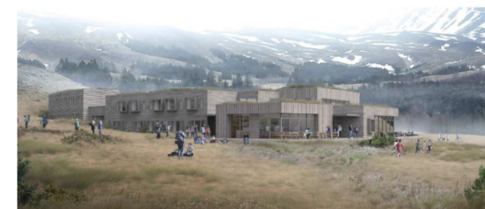
Skýringarmynd sem sýnir tillögu að ásynd úr suðvestri.

Deiliskipulagsbreyting þessi sem fengið hefur meðferð í samræmi við ákvæði 1. mgr. 43. gr. skipulagslaga nr. 123/2010 var samþykkt í _____ þann _____ 20___ og í _____ þann _____ 20___.