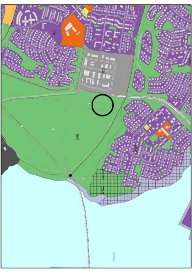
HLUTI ADALSKIPULAGS REYKJAVÍKUR 2010-2030