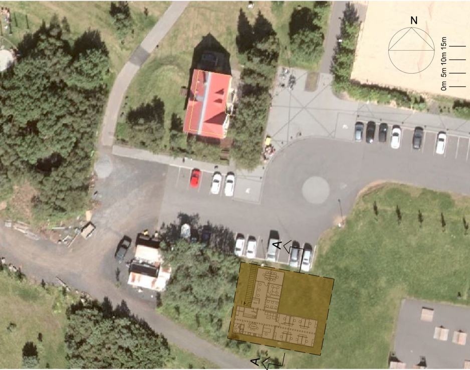
Skýringarmynd - ofan á loftmynd