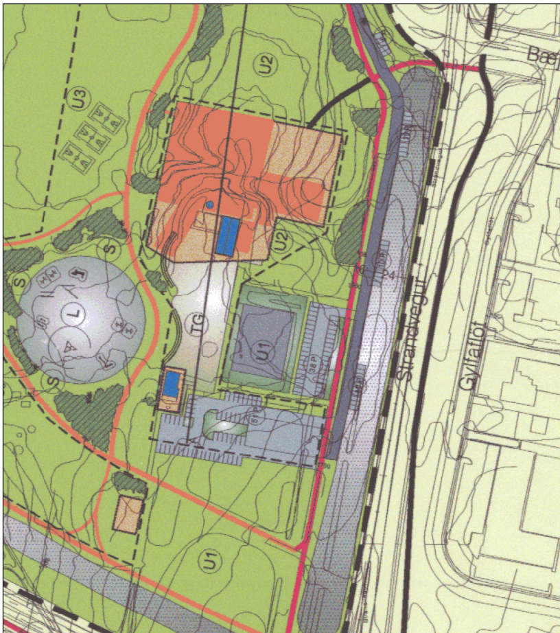
Hluti gildandi deiliskipulags Gufunes mkv.1:2000 samþykkt í borgarráði 20.mai 2010