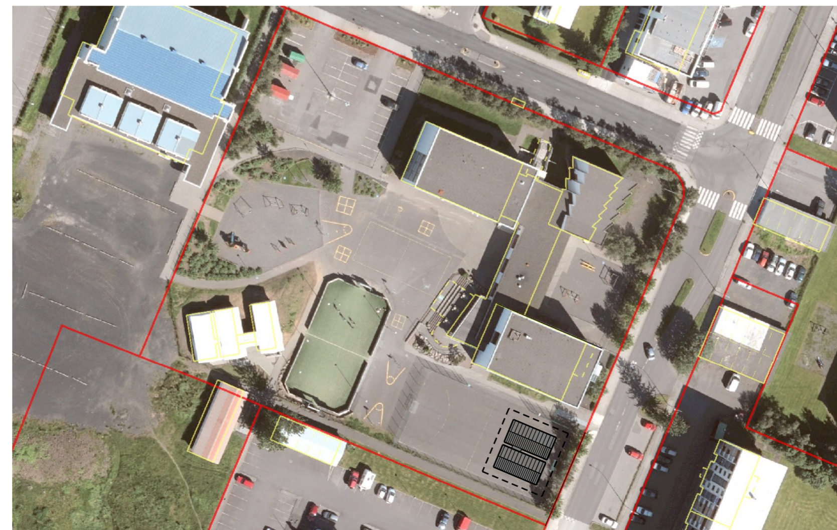
Skýringarmynd: Loftmynd með færarlegum kennslustofum bætt inn á.