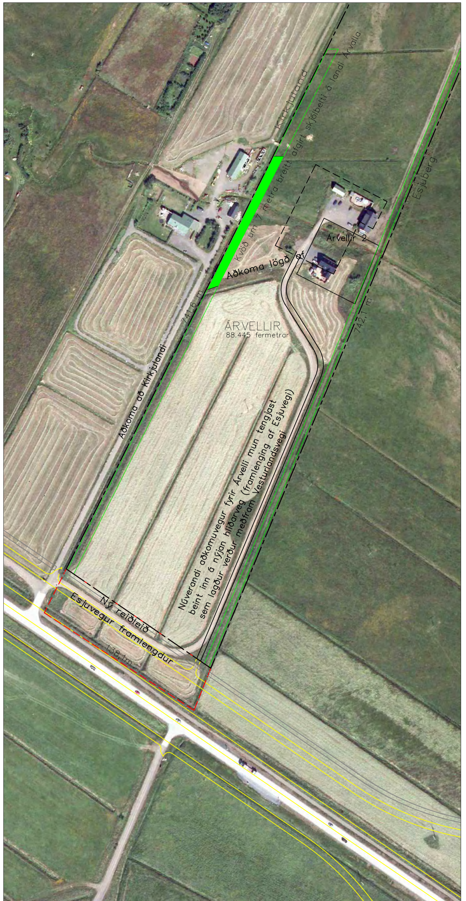
Gildandi deiliskipulag Árvalla samþykkt 20.06.2000 mkv 1:2000