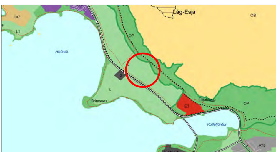
Hluti gildandi aðalskipulags Reykjavíkur 2010-2030, samþykkt 24.02.2014