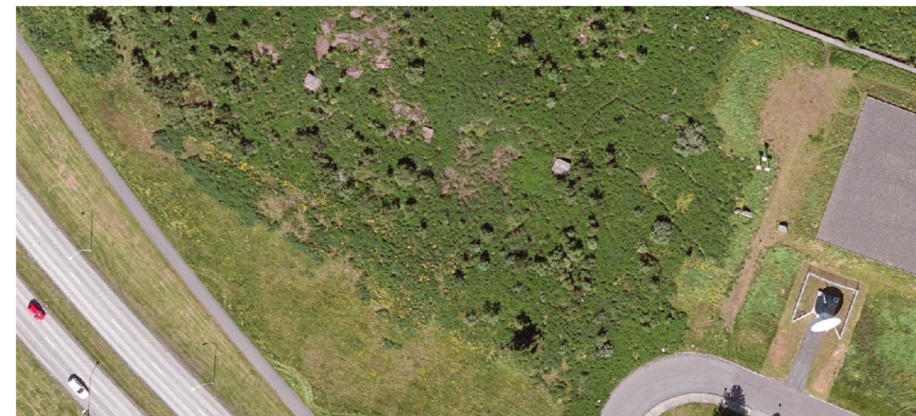
LOFTMYND 1:1000 (tekin 17/7/2018, Borgarvefsjá)

Hámarkshæð húsa er 3,5 m frá gólfkóta. Gólfkóti húsanna verður í u.þ.b. sama plani og aðliggjandi umhverfi. Nýtingarhlutfall er 0,1