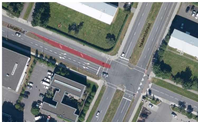
Gatnamót Háaleitisbrautar og Listabrautar. Lagt er til að rauðmerkt akrein verði fjarlægð en þess í stað verður breiðari miðeyja milli akstursstefna.

Lagfæringar á umhverfi eru almennt séð minniháttar lagfæringar t.d. á kantsteinum, gerð leiðarlína og varúðarsvæðis en á tveimur gatnamótum og einni gönguþverun