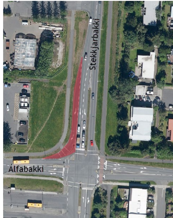
Gatnamót Stekkjarbakka og Álfabakka. Lagt er til að rauðmerkt akrein verði fjarlægð.

Á gatnamótum Háaleitisbrautar og Listabrautar er lagt til að fjarlægja stutta akrein á Listabraut til vesturs, sem ekki er þörf fyrir. Um er að ræða leifar af eldri útfærslu gatnamótanna. Á gatnamótum Stekkjarbakka og Álfabakka er lagt til að afnema hægribeygjuframhjálaup frá Stekkjarbakka vestur Álfabakka. Umferð um umrædda beygju er ekki mikil og hefur breytingin hverfandi áhrif á afköst gatnamótanna. Þar sem forgangskerfi fyrir Strætó verður virkjað á sama tíma hefur breytingin einnig hverfandi áhrif á Strætó. Í báðum tilfellum styttist leið óvarinna vegfarenda yfir götuna. Þannig fæst öruggari gönguleið og vistlegra umhverfi. Á Lönguhlíð, milli Eskitorgs og Blönduhlíðar, hefur um árabíl verði ljósastýrð göngupverun. Lagt er til að samhliða endurnýjun á búnaði verði göngupverunin færð norður fyrir Blönduhlíð. Í dag er engin göngupverun þar. Helsti kostur þess að færa göngupverunina og umferðarljósinn norðar er að ljósin hafa þá síður truflandi áhrif á umferð um hringtorgið en nýtast engu að síður gangandi vegfarendum vel. Tillagan er í samræmi við afstöðu íbúaráðs miðborgar og Hlíða en ráðið fékk þrjá valkosti að útfærslu göngupverunar til umfjöllunar, þar á meðal einn sem gerði ráð fyrir óbreyttri útfærslu. Íbúðaráðið leitaði til íbúasamtaka 3. hverfis um afstöðu í ferlinu.