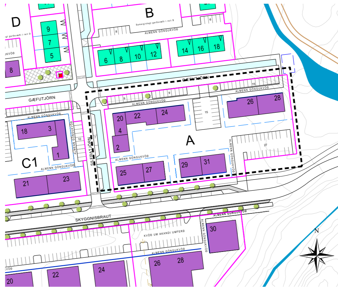
Tillaga að breytingu á deiliskipulagsuppdrætti 1:1500.

Breyting á deiliskipulagi nær eingöngu yfir reit A, þ.e. Skyggnisbraut nr. 25-27 og 29-31, Gæfutjörn nr. 20-24 og 26-28 og Silfratjörn nr. 2-4.