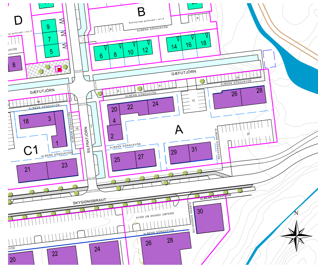
Gildandi deiliskipulagsuppdráttur 1:1500

Heildardeiliskipulag fyrir uppbyggingu í Úlfarsárdal var samþykkt í Umhverfis- og skipulagsráði þann 27. september 2017 og í Borgarráði þann 3. október 2017. Það öðlaðist gildi með birtingu í B-deild Stjórnartíðinda þann 6. febrúar 2018. Deiliskipulagsbreytingin nær eingöngu til yfir reit A, þ.e. Skyggnisbraut nr. 25-27 og 29-31, Gæfutjörn nr. 20-24 og 26-28 og Silfratjörn nr. 2-4.