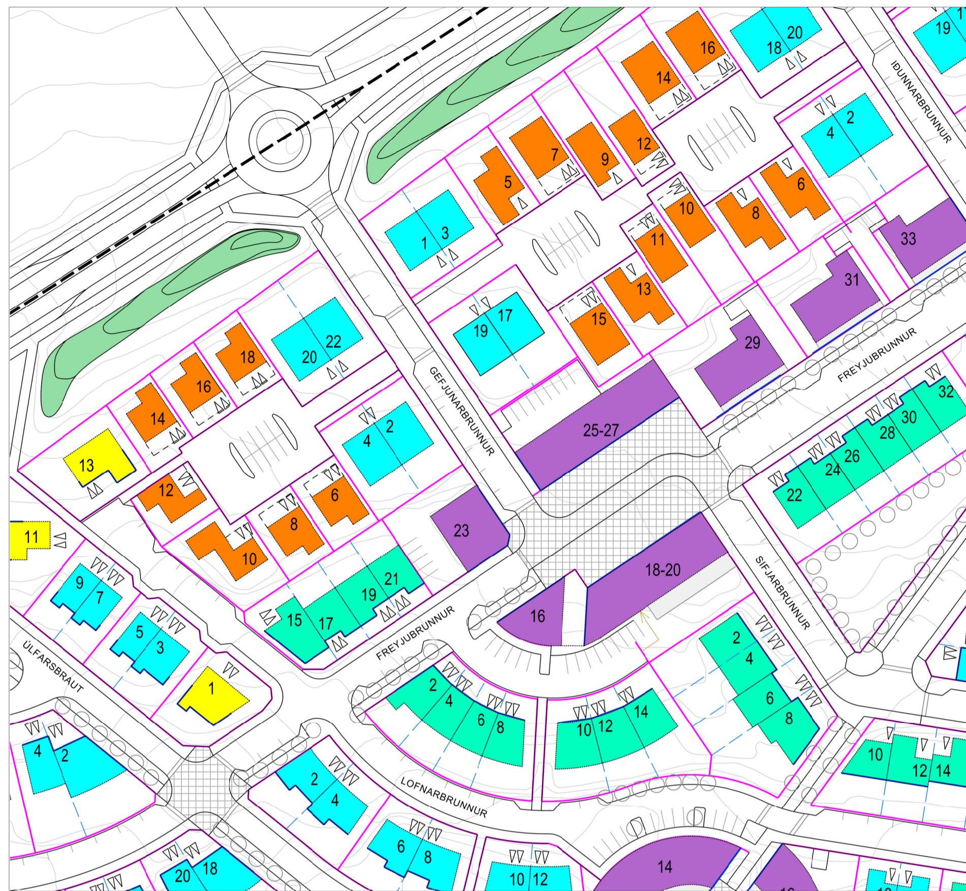
HLUTI GILDANDI DEILISKIPULAGS FYRIR ÚLFARSÁRDALSHVERFI, mkv.: 1: 1000 Samþykkt í umhverfis- og skipulagsráði þann 27. september 2017 og í borgarráði 5. október 2017 og birt í B-deild Stjórnartíðinda þann 19. febrúar 2018.