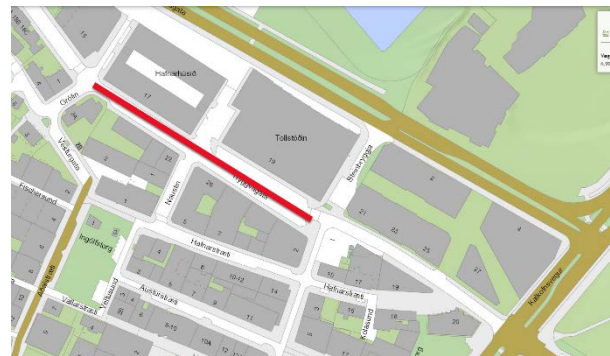
Mynd 1 Kaflinn sem um ræðir merktur með rauðu. (kort www.borgarvefsja.is .)