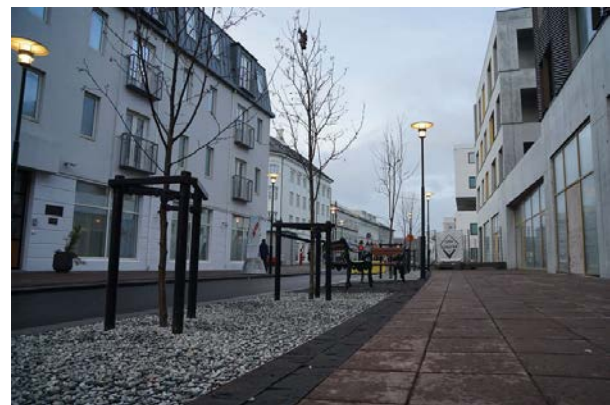
Mynd 2 Tryggvagata við Hafnartorg eftir breytingar. Horft til vesturs