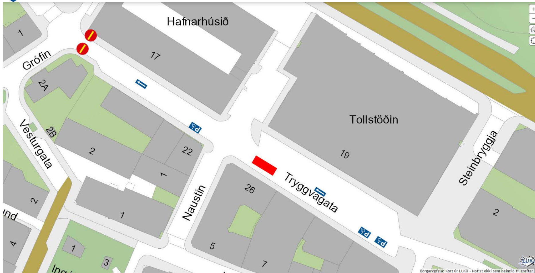
Mynd 2 – Tillaga að breytingu á bílaumferð og stæðum. Rauða svæðið tákna staðsetningu vöruloserstæði.