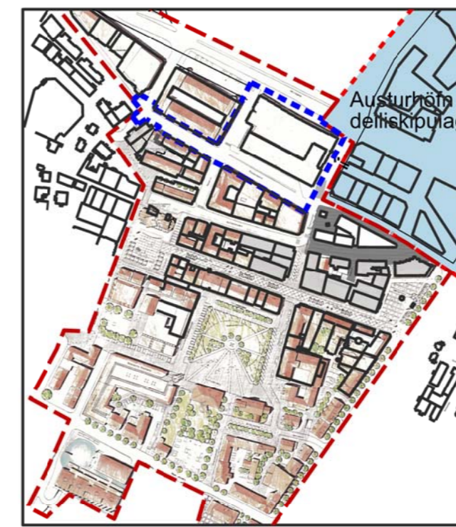
Skýringarmynd - Kvosarskipulag