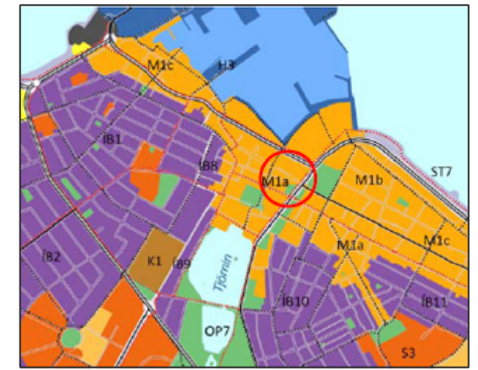
Hluti úr aðalskipulagi Reykjavíkur 2010-2030 - staðsetning breytingar.