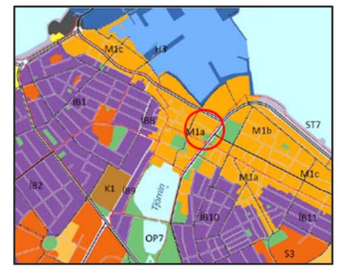
Hluti úr aðalskipulagi Reykjavíkur 2010-2030 - staðsetning breytingar.