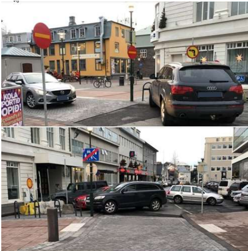
Mynd 2 Vandræði skapast á Tryggvagötu við Pósthússtræti ef heimilt er að aka í báðar áttir eftir götunni