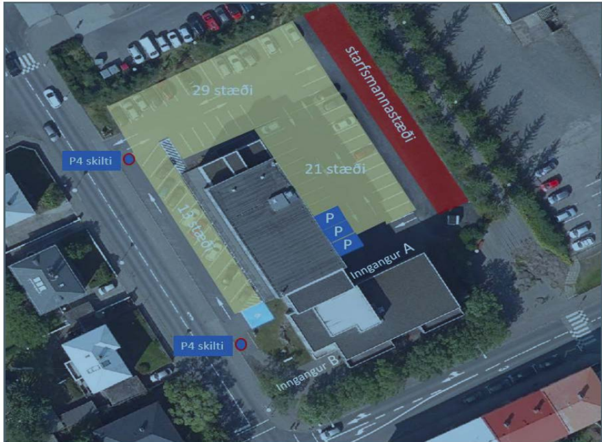
Mynd 1. Nýtt gjaldskylt svæði á Eiríksgötu 5.

Bréf Landspítalans, dags. 22. október 2020