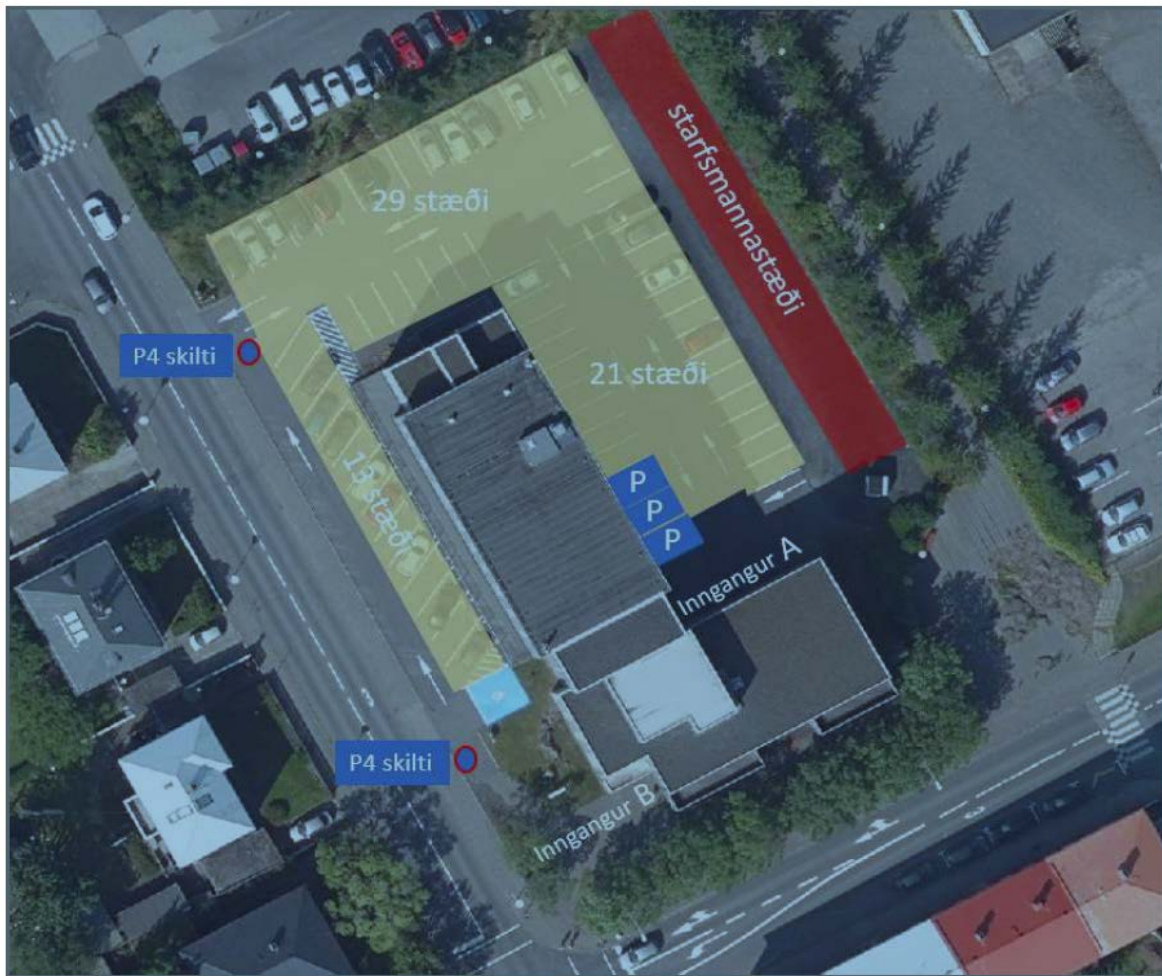
Mynd 1. Nýtt gjaldskylt svæði á Eiríksgrötu 5.