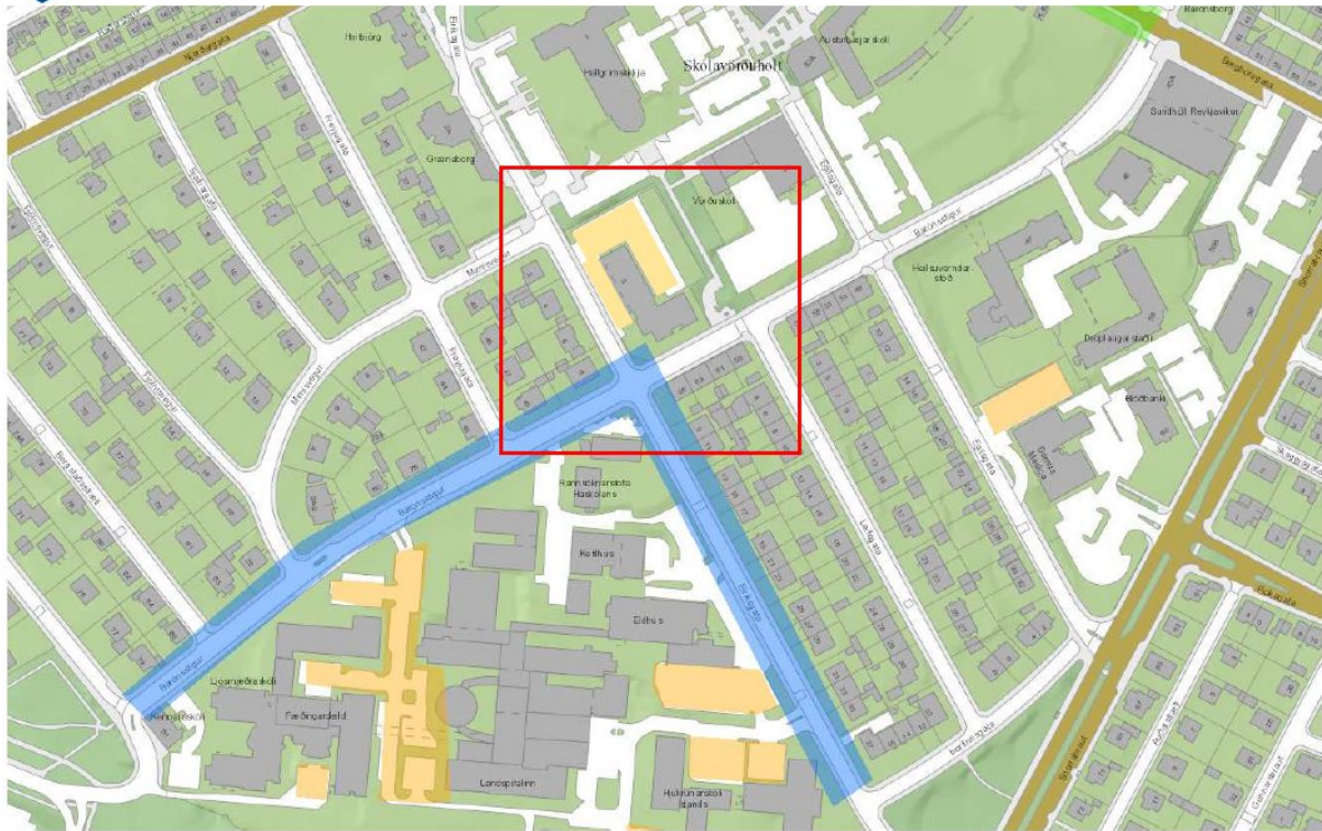
Mynd 2. Nýtt gjaldskylt svæði á Eiríksgötu sýnt í Borgarvefsjá.