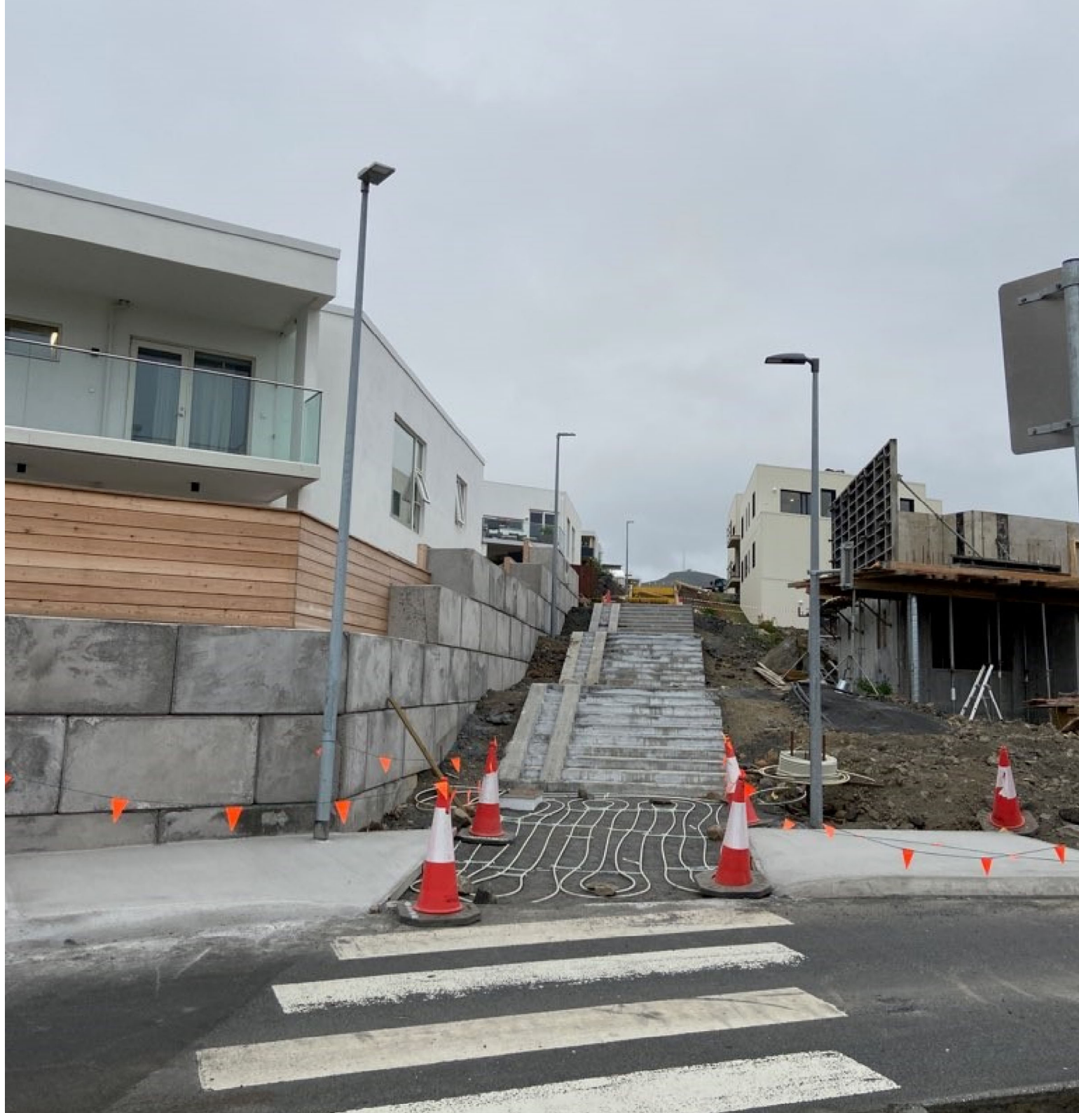
Horft frá Lofnarbrunni að Sifjarbrunni