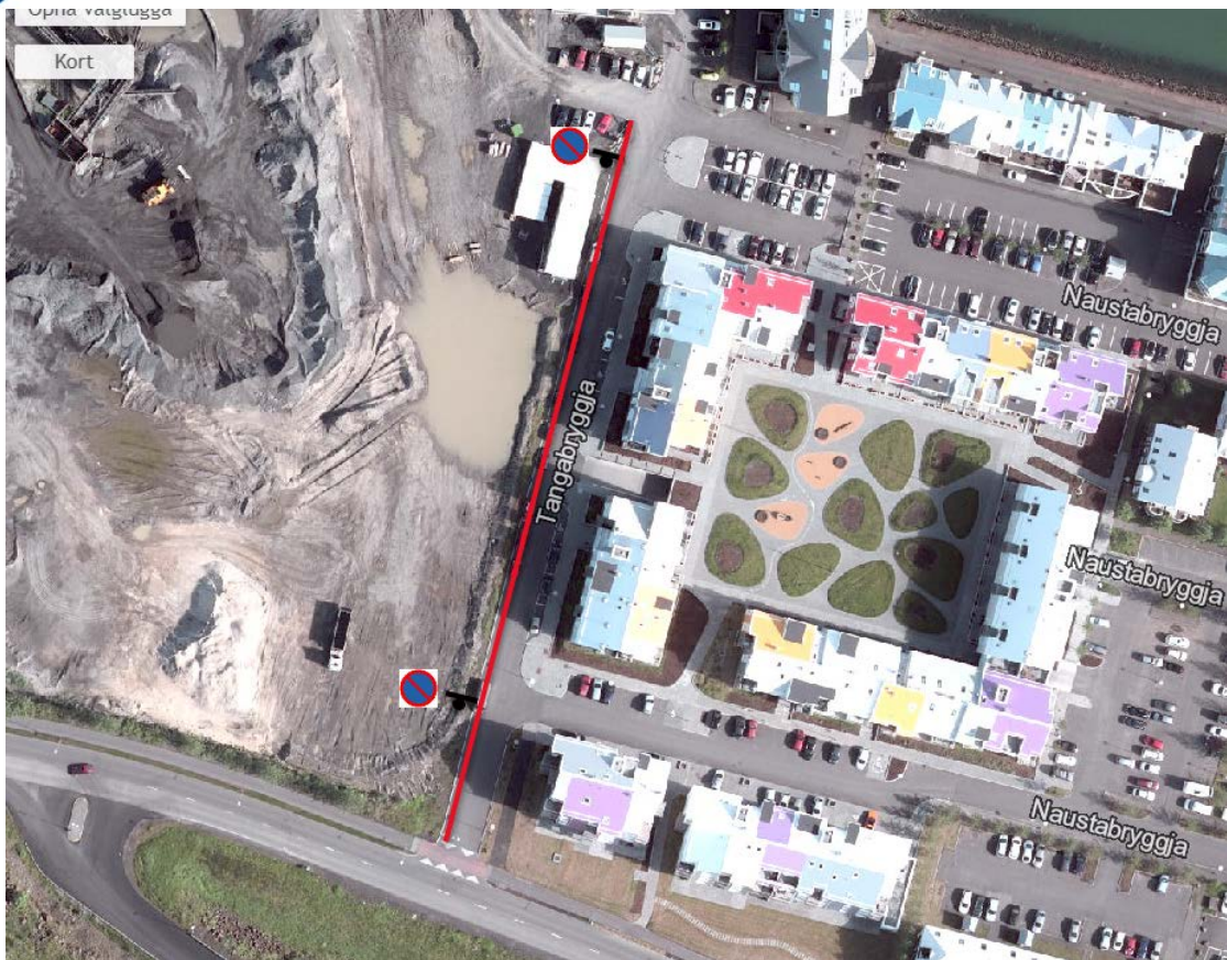
Mynd 1 Lagt er til að óheimilt verði að leggja við vesturkant Tangabryggju.