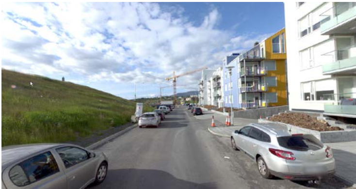
Mynd 2 Tangabryggja. Ökutæki leggja við götukant og þrengja að umferð og takmarka yfirsýn á gatnamótum og við bílakjallara.