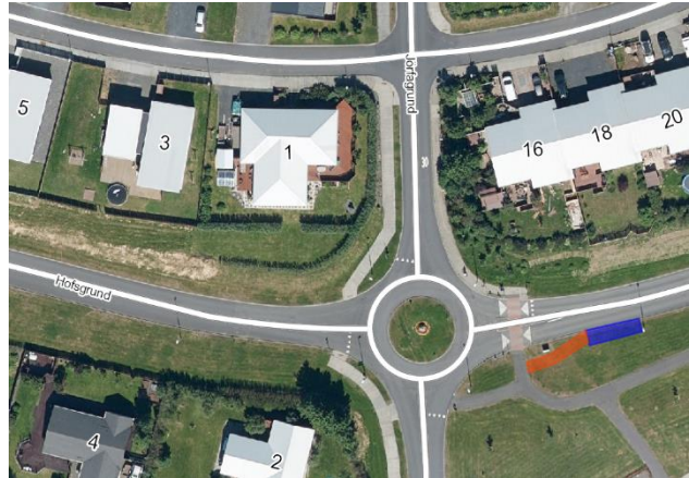
Mynd 3 - Tillaga að staðsetningu strætóstöðvar við Hofsgrund, sunnan götunnar við hringtorg að Jörfagrund og Esjugrund.

Á Hofsgrund við hringtorg að Jörfagrund og Esjugrund er lagt til að útbúin verði strætóstöð fyrir pöntunarþjónustu. Lagt er til að stöðin verði sunnan götunnar, þ.e. við akrein í átt að Vesturlandsvegi. Tillaga að staðsetningu stöðvarinnar er innan 400 metra radíus frá öllu íbúðarhúsnæði Grundarhverfis og er staðsett þar sem aðkoma Strætó er auðveld bæði til og frá Vesturlandsvegi.