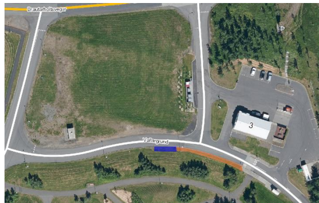
Mynd 2 - Tillaga að strætóstöð fyrir áætlunarleið við Vallargrund

Við Vallargrund er lagt til að gerð verði ný strætóstöð vestan tengivegs af Vallargrund á Brautarholtsveg, við Olís, ásamt gangstéttartengingu við stígakerfið nær því sem nú er strætóstöð. Tillaga að staðsetningu stöðvarinnar auðveldar Strætó að komast af og aftur á Vesturlandsveg eftir fækkun gatnamóta. Tillaga að staðsetningu er ekki fjarri núverandi stöð við Olís og myndi því ekki hafa teljandi áhrif á gönguleiðir að- og frá stöðinni. Kostur staðsetningarinnar er að íbúar þurfa ekki að fara yfir Vallargrund á leið sinni milli biðstöðvar og heimilis.