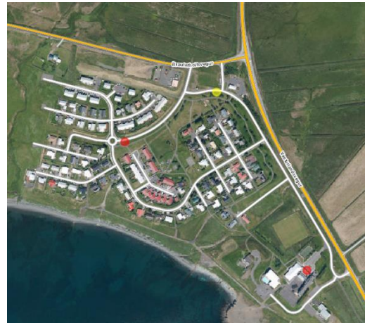
Mynd 1 - Lagt er til að stöð við gulan punkt verði þjónustuð af áætlunarleið Strætó, en stöðvar við rauðu punktana verði þjónustaðar eftir pöntun.

Lagt er til að útbúnar verði 3 nýjar stöðvar í stað þeirra á Vallargrund sem Strætó hyggst hætta að þjónusta. Breytingar á þjónustu Strætó eru tengdar við breikkun Vesturlandsvegur, en stefnt er að því að áætlunarleið stöðvi við nýja stöð á Vallargrund við Olís og að útbúnar verði 2 strætóstöðvar sem þjónustaðar væru af pöntunum.