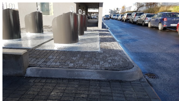
Mynd 2 Myndir sem sýna hvernig lagt er í Jaðarleiti í dag. Önnur af tveimur djúpgámasamstæðum sést á hægri myndinni.