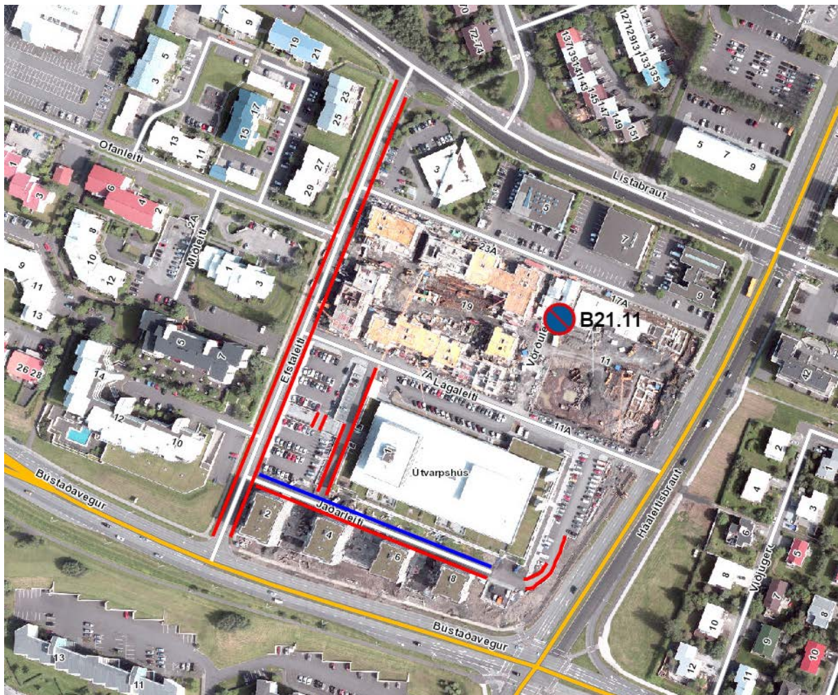
Mynd 1 Lagt er til að óheimilt verði að leggja við á þeim stöðum sem merktir eru með rauðu. Þegar er í gildi bann við því að leggja þar sem merkt er með bláu. ( www.borgarvefsja.is , LUKR/Samsýn)