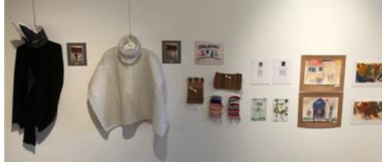
Hér má sjá verk barna frá Jöklaborg.

Barnamenningarhátíð var haldin í Gerðubergi og sýndu börn í Jöklaborg verk sín og var sýningin formlega opnuð 9. apríl og stóð til 14. apríl.