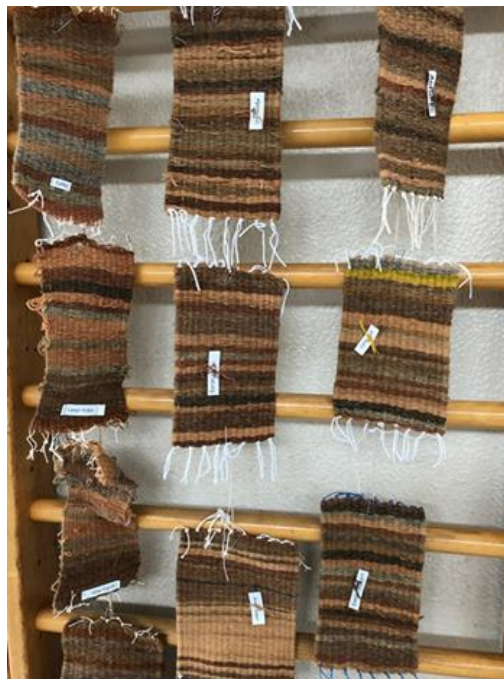
Elstu börnin lita garn og vefa í vefstól

Flæði á Heimahöll og Heimahlíð: Stöndum okkur vel, fellur sjaldan miður. Börnin fara mismikið á milli deilda. Skipta þarf starfsfólki betur niður þannig að starfsmaður frá Heimahlíð komi á Heimahöll og öfugt. Halda þessu fyrirkomulagi óbreyttu. Fimm börn á Heimahöll hefðu mátt fara í flæði á deildum eldri barna en fóru ekki.