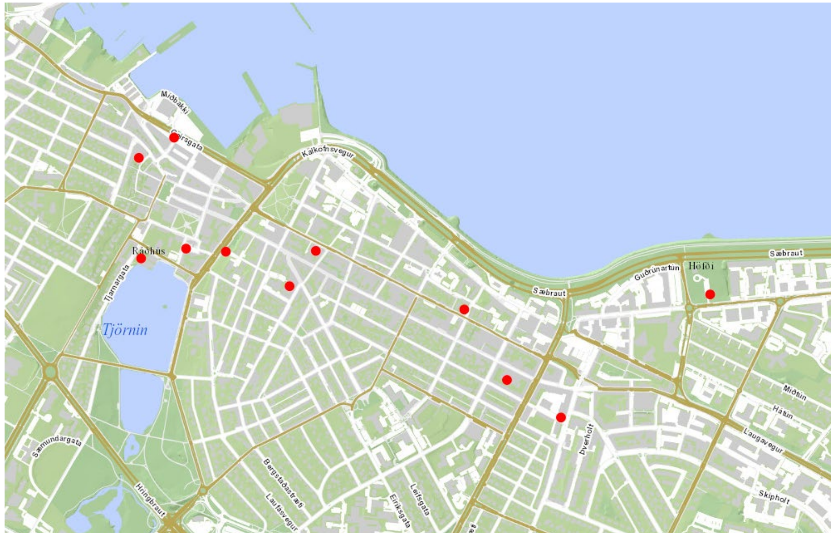
Mynd 2 - Staðsetningar stæða sem lagt er til að verði merkt sem bifreiðastæði sem eingöngu eru ætluð bifreiðum sem þurfa rafhleðslu.