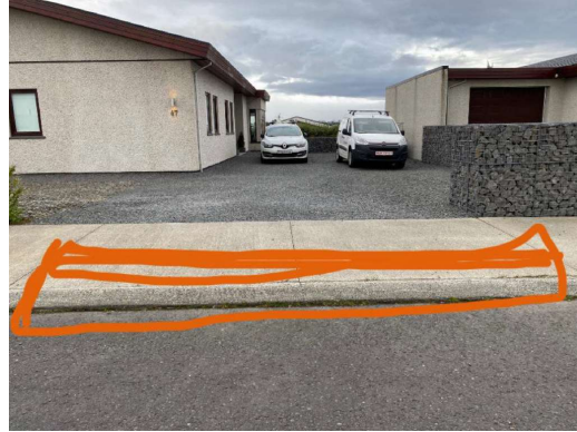
Mynd með fyrirspurn: Staðsetning nýrrar innkeyrslu og bílastæða

Í fyrirspurn eru nefnd dæmi um breiðari innkeyrslur á nokkrum lóðum í hverfinu (þær séu 8-9 m breiðar) og einnig tekið fram að í hverfinu séu dæmi um tvær innkeyrslur á sömu lóðina.