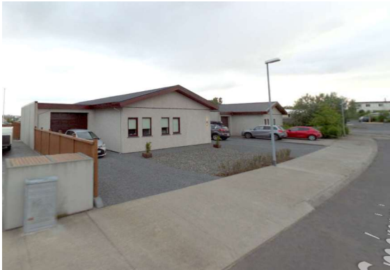
Skjáskot frá götu (2017)