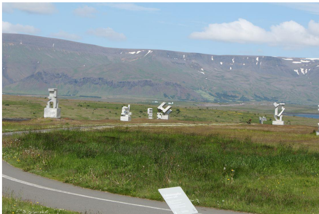
Mynd 8. Hallsteinsgarður, séð til norðurs.