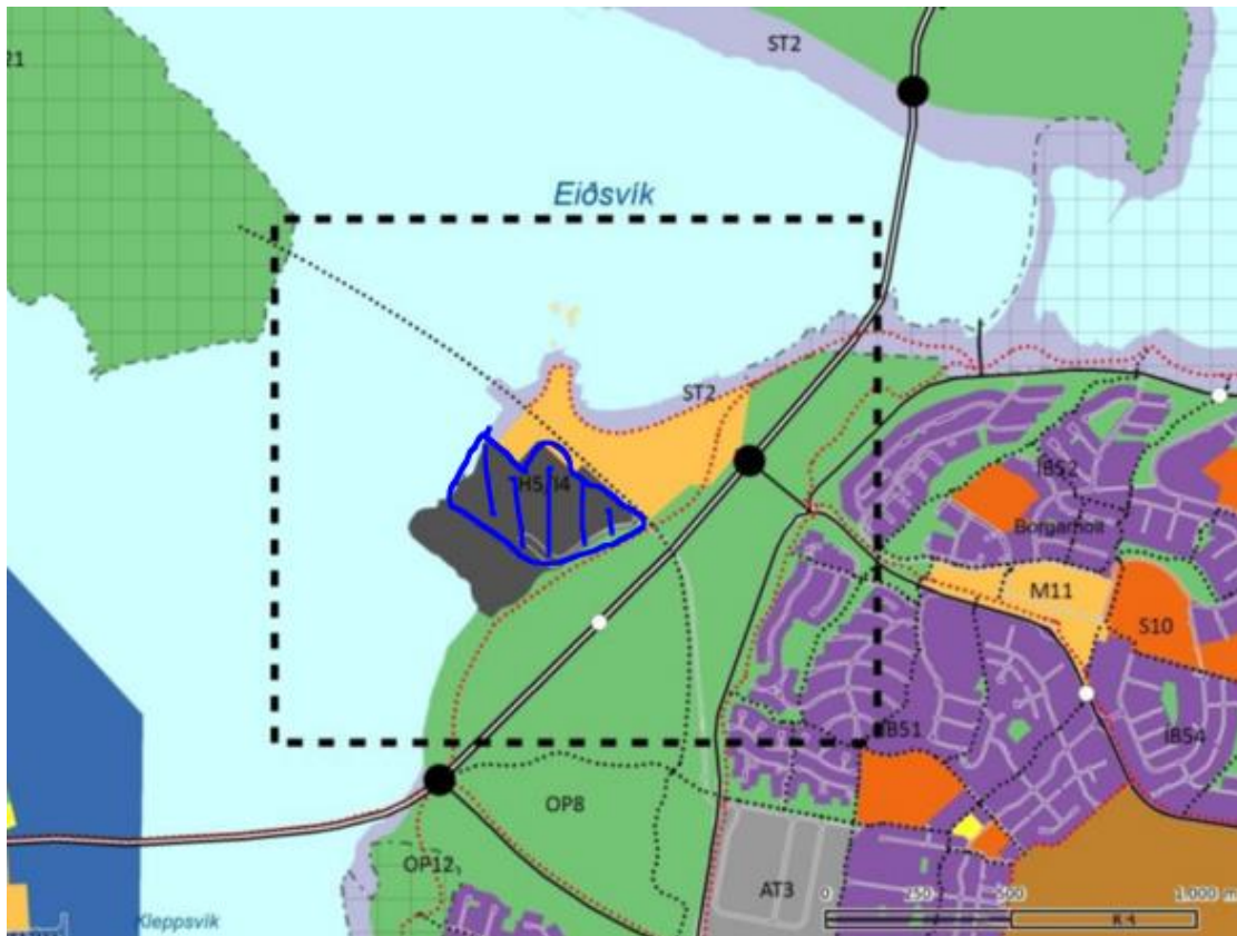
Mynd 6. Uppbyggingarsvæðið í Gufunesi 1.áfangi er merkt með gulum lit, miðsvæði. Fyrirhugað stækkunarsvæði miðsvæðis í aðalskipulagi er sýnt blámerkt.