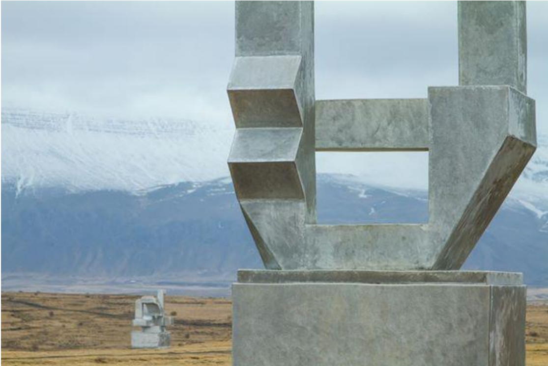
Mynd 9. Frá Hallsteinsgarði.