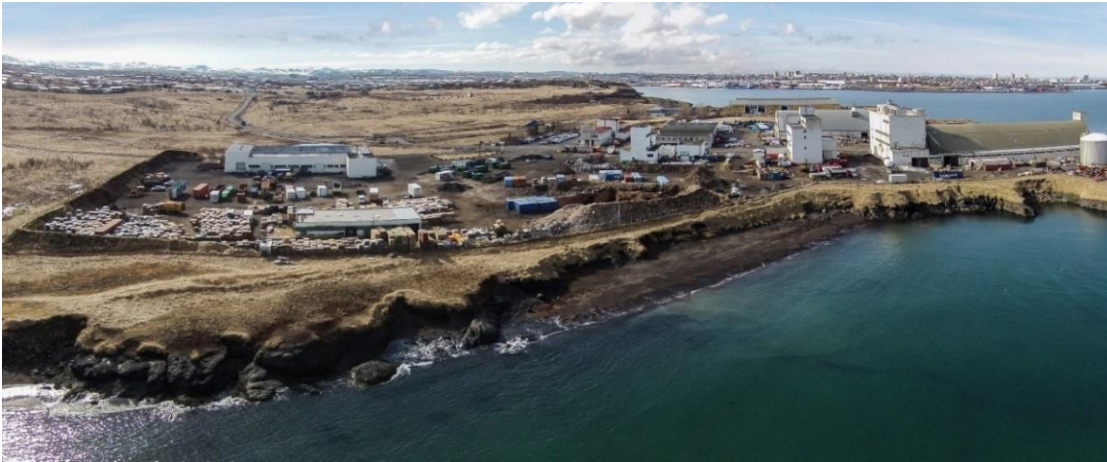
Mynd 2. Gufunes 1.áfangi, fjær sést í útivistarsvæðið.

Forsendur þessarar skiplagsvinna eru að þörf er á bættum samgöngutengingum frá nýlega skipulögðu svæði í Gufunesi, áfangi 1, bæði aksturstengingar og stígatengingar upp á Strandveg til að tengja Gufunesið betur við Grafarvog. Samhliða þessu skipulagi þá verður farið í endurskoðun á deiliskipulagi fyrir útivistarsvæðið. Enn á eftir að móta hugmyndir um útivistarsvæðið eftir niðurstöður í fyrrnefndri samkeppni, en um er að ræða eitt mikilvægasta útivistarsvæðið í Grafarvogi og skilgreindan borgargarð í aðalskipulagi Reykjavíkur 2010-2030 sem þarf að styrkja og gefa meira vægi. Uppbygging er hafin á svæði 1.áfanga í Gufunesi og þykir ljóst að með íbúum á svæðinu og meiri starfsemi með tíð og tíma þá kallar það á betri tengingar inn/ út úr hverfinu. Skoðaðar hafa verið samgöngutengingar til þess og m.a. varðandi skólatengingar. Sjá drög hér að neðan, mynd 3.