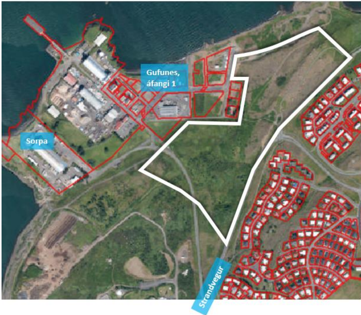
Mynd 4. Afmörkun skipulagssvæðis. Hvíta línan afmarkar svæðið.

Skipulagssvæðið afmarkast af deiliskipulagi útivistarsvæðisins til suðurs, Gufunessvæðinu 1.áfangi til norðvesturs og norðurs og Strandvegi til austurs. Hallsteinsgarður er innan þessa svæðis. Nánari afmörkun verður sett fram í deiliskipulaginu. Um er að ræða tæplega 20 hektara svæði í heild. Ekki er gert ráð fyrir neinni uppbyggingu í þessu skipulagi umfram samgöngutengingar, en þá jafnframt yrði núverandi Hallsteinsgarður festur inn í skipulagsáætlunina.