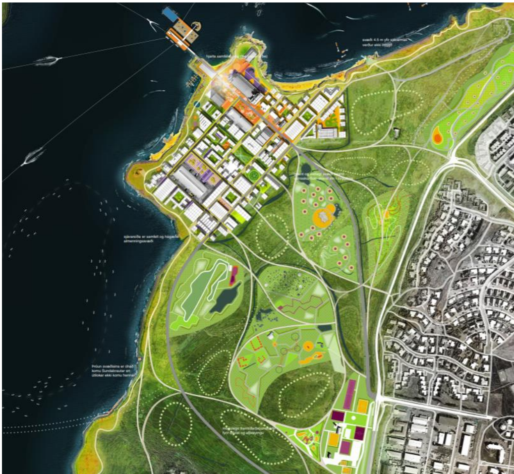
Mynd 1. Vinningstillaga Jvantspíjker + Felixx.

Forsaga þess er að haldin var hugmyndasamkeppni um skipulag Gufunessvæðisins í heild árið 2016 og vinningstillaga valin í lok árs 2016. Markmið borgarinnar með samkeppninni var að kalla eftir hugmyndum að skipulagi og hönnun fyrir svæðið sem væri í samræmi við meginstefnu í gildandi aðalskipulag Reykjavíkur 2010-2030. Skipulag svæðisins hafði lengi verið órætt og miklar umræður um framtíðarþróun þess, og var því kominn til að fá upp hugmyndir að framtíðarþróun og raunhæfar tillögur á svæðinu. Að það fái fallett heildaryfirbragð og svæðið geti þróast og öðlast samhangandi hlutverk til framtíðar sem stuðlar að fjölbreyttri notkun þess. Vinningstillaga Jvantspíjker + Felixx einblíndi á svæðið við gömlu Áburðarverksmiðjuna og hefur sem fyrr segir verið unnið deiliskipulag fyrir 1.áfangna þess og 2. áfangi er í undirbúningi. Framkvæmdir eru hafnar á nokkrum lóðum þar og almenn uppbygginga hafin að nokkru leyti. Svæðið mun taka á sig mynd á næstu 2-3 árum þegar íbúar fara að flytja inn og með auknum umsvifum fyrirtækja á svæðinu.