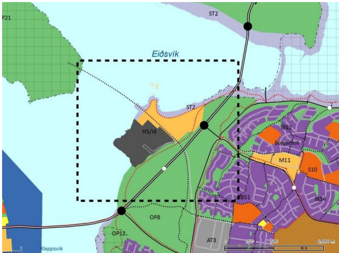
Mynd 5. Landnotkun á Gufunesvæðinu skv. Aðalskipulagi Reykjavíkur 2010-2030. Uppbyggingarsvæðið í Gufunesi 1.áfangi er merkt með gulum lit, miðsvæði.

Norðaustan þess og norðan er Eiðsvík og Geldinganes og að sunnan Grafarvogurinn. Frístundamiðstöðin Gufunesbær var stofnuð haustið 1998 og sér Íþrótt- og tómstundaráð Reykjavíkur um hana.