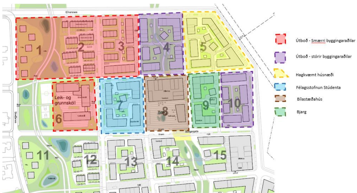
Mynd 3: Úthlutunaráætlun fyrir fyrsta áfanga nýrrar byggðar við Skerjafjörð

Gert er ráð fyrir að deiliskipulagsinna verði á hendi borgarinnar, unnið af ASK arkitektum, með aðkomu þróunaraðilanna. Með því verður tryggt að skipulagsvinna getu unnist hratt og örugglega, ásamt því að tryggt er að götur, torg og græn svæði fá skilmerkilega umfjöllun í deiliskipulagi.