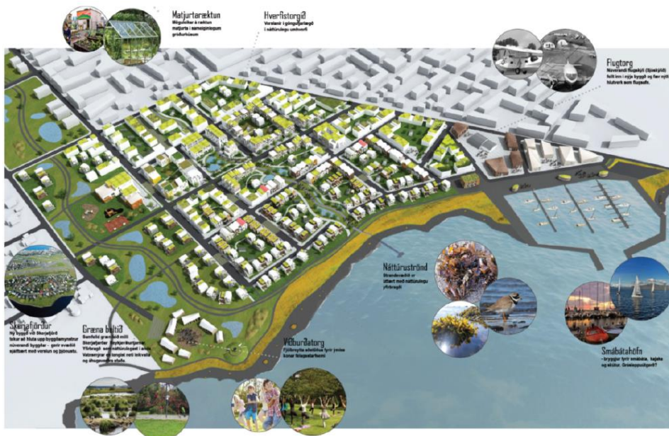
Mynd 1. Sigurtillaga ASK, Landslags og EFLU

Umhverfis- og skipulagsvið lagði fram forsögn vegna rammaskipulagsins 15. nóvember 2017 sem umhverfis- og skipulagsráðs samþykkti til kynningar. Þann 16. maí 2018 samþykkti umhverfis og skipulagsráð tillögu að rammaskipulag fyrir svæðið og bókaði að skipulagsfulltrúa yrði falið að hefja vinnu við deiliskipulag svæðisins.