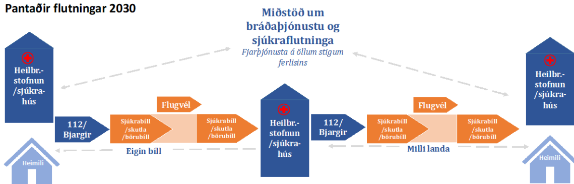
Mynd 2: Pantaðir flutningar 2030