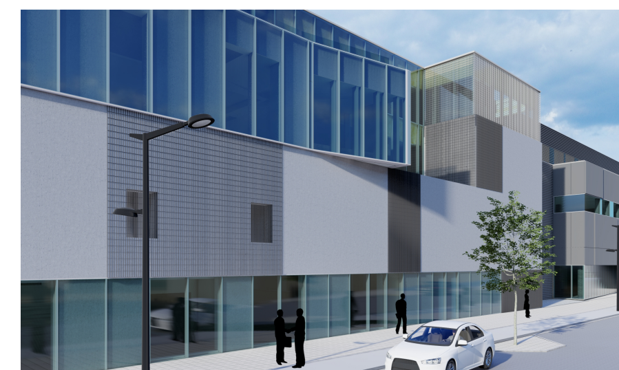
ÞRÍVÍDDARMYND EFTIR BREYTINGU Horft suður eftir Sæmundargötu

PK ARKITEKTAR BRAUTARHOLT 4 105 REYKJAVÍK Sími 5518050 / 8997097 www.pk.is