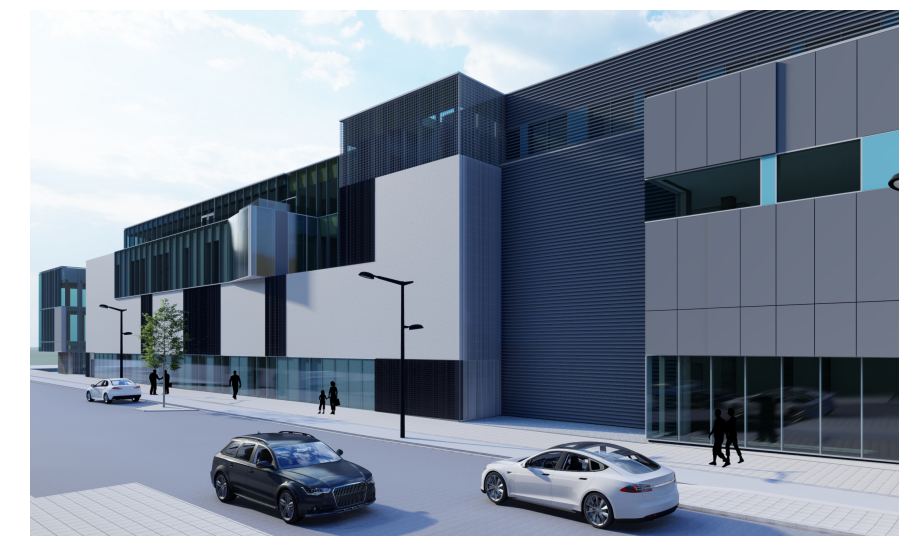
ÞRÍVÍDDARMYND EFTIR BREYTINGU Horft suður eftir Sæmundargötu