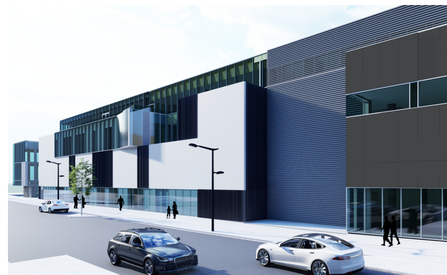
ÞRÍVÍDDARMYND FYRIR BREYTINGU Horft norður eftir Sæmundargötu