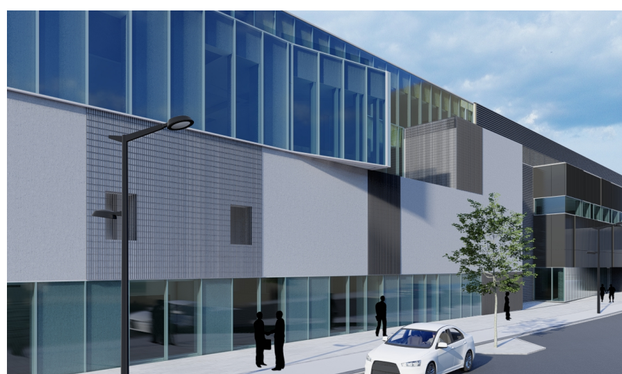
ÞRÍVÍDDARMYND FYRIR BREYTINGU Horft norður eftir Sæmundargötu