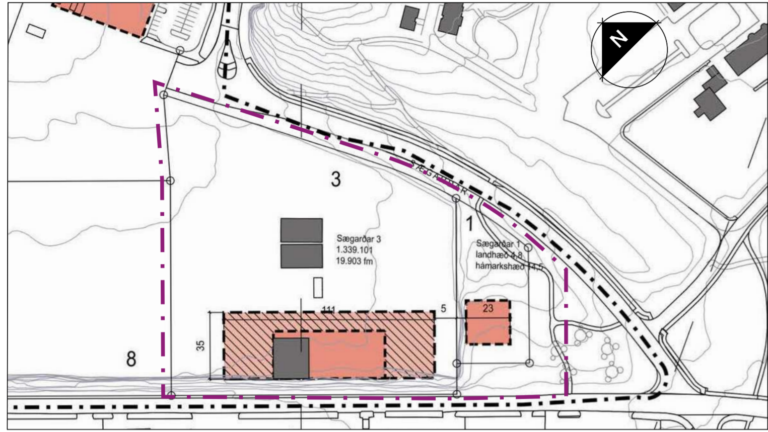
Hluti af gildandi deiliskipulagi Vatnagarða, samþykkt í Borgarráði 15.05.2014 mkv. 1:2000