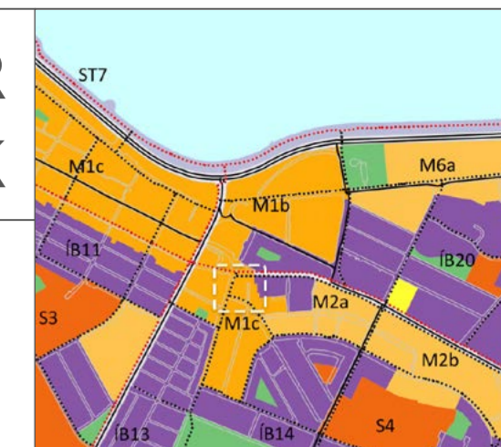
Hluti úr Aðalskipulagi Reykjavíkur 2010-2030.