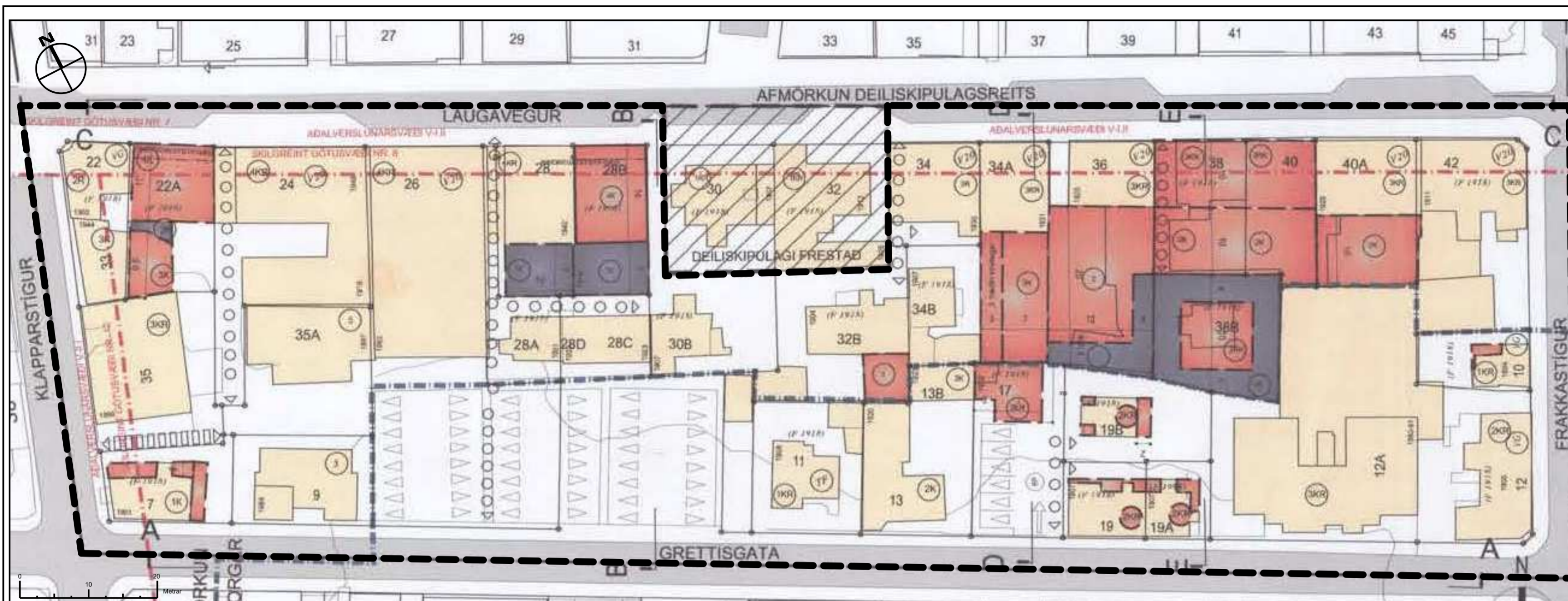
GILDANDI DEILISKIPULAG DAGS. 25.03.2003