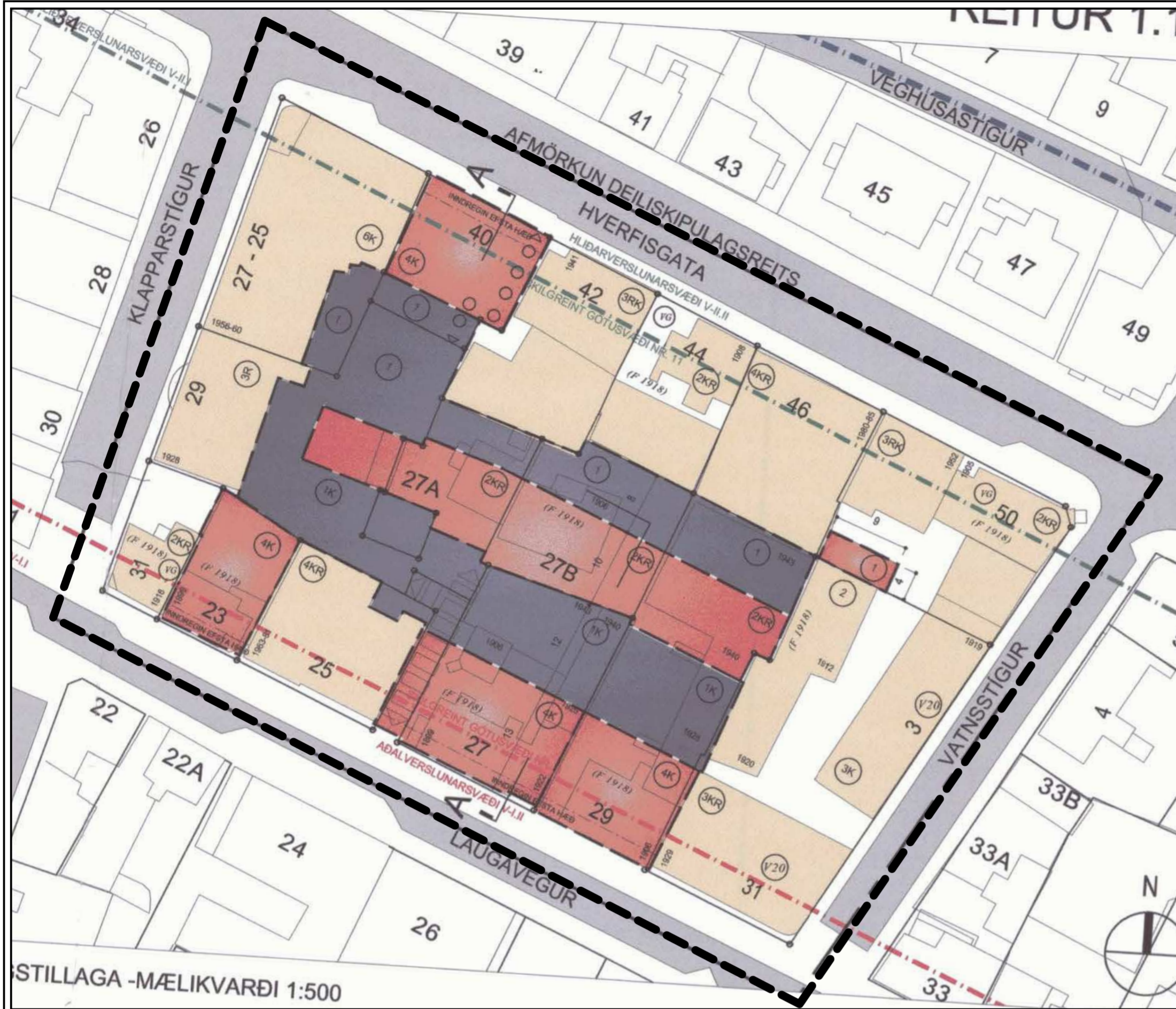
GILDANDI DEILISKIPULAG DAGS. 25.03.2003