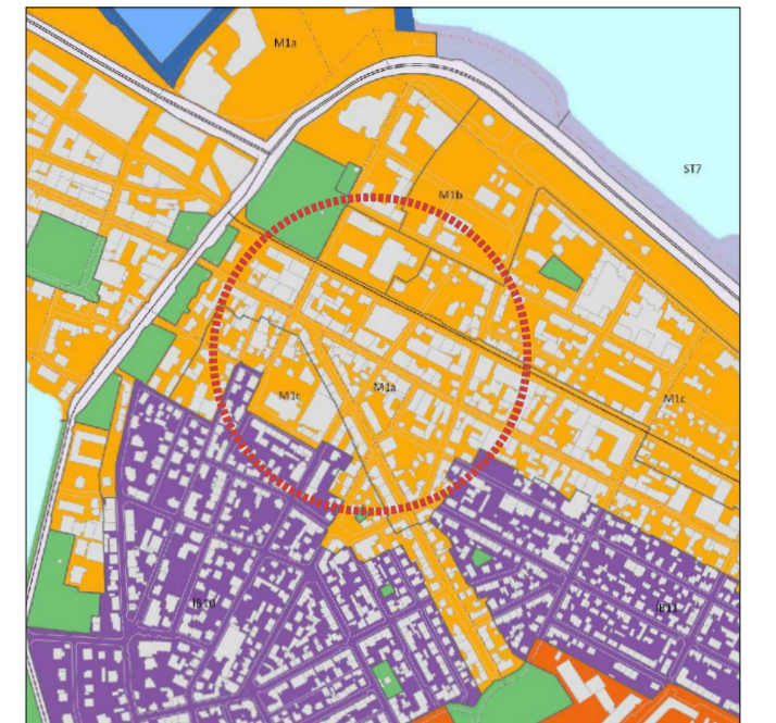
HLUTI GILDANDI AÐALSKIPULAGS 2010-2030