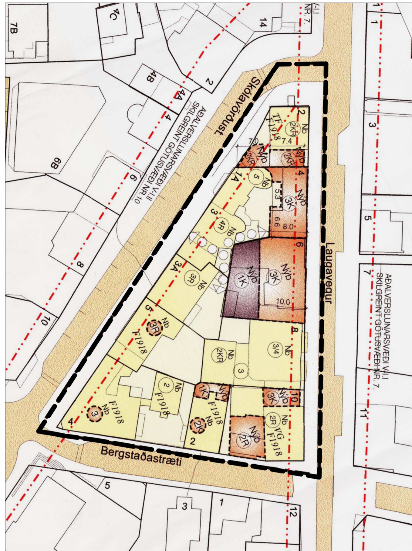
GILDANDI DEILISKIPULAG DAGS 15.05.2002