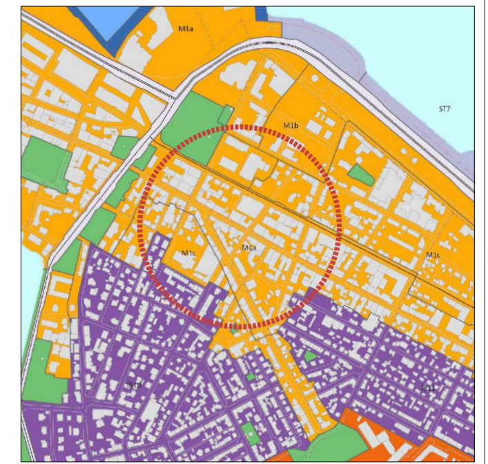
HLUTI GILDANDI AÐALSKIPULAGS 2010-2030