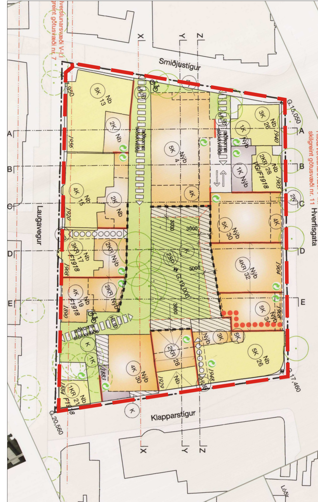
TILLAGA AÐ BREYTTUM DEILISKIPULAGSMÖRKUM

Í gildi er deiliskipulag staðgr. 1.171.1, Hljómalindareitur, dags. 13.04.2004, síðast breytt 10.11.2017 sem þarf að breyta svo að ekki verði skörun á skipulagsmörkun á milli skipulagssvæða vegna nýs deiliskipulags fyrir hluta Laugvegur vegna göngugötu. Breytingin felst eingöngu í því að mörkun deiliskipulagsins er breytt á þann hátt að í stað þess að mörkin liggja í miðri götu eru þau færð inn að lóðarmörkun við Laugaveg og Klapparstíg.