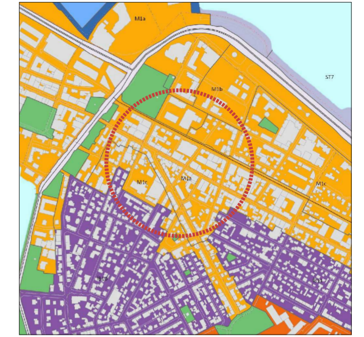
HLUTI GILDANDI AÐALSKIPULAGS 2010-2030

Deiliskipulag þetta sem fengið hefur meðferð í samræmi við ákvæði 41. gr skipulagslaga nr 123/2010 var samþykkt í _____ þann _____ 2019 og í _____ þann _____ 2019. Tillagan var auglýst frá _____ 2019 með athugasemdafresti til _____ 2019. Auglýsing um gildistöku deiliskipulagsins var birt í B-deild Stjórnartíðinda þann _____ 2019.