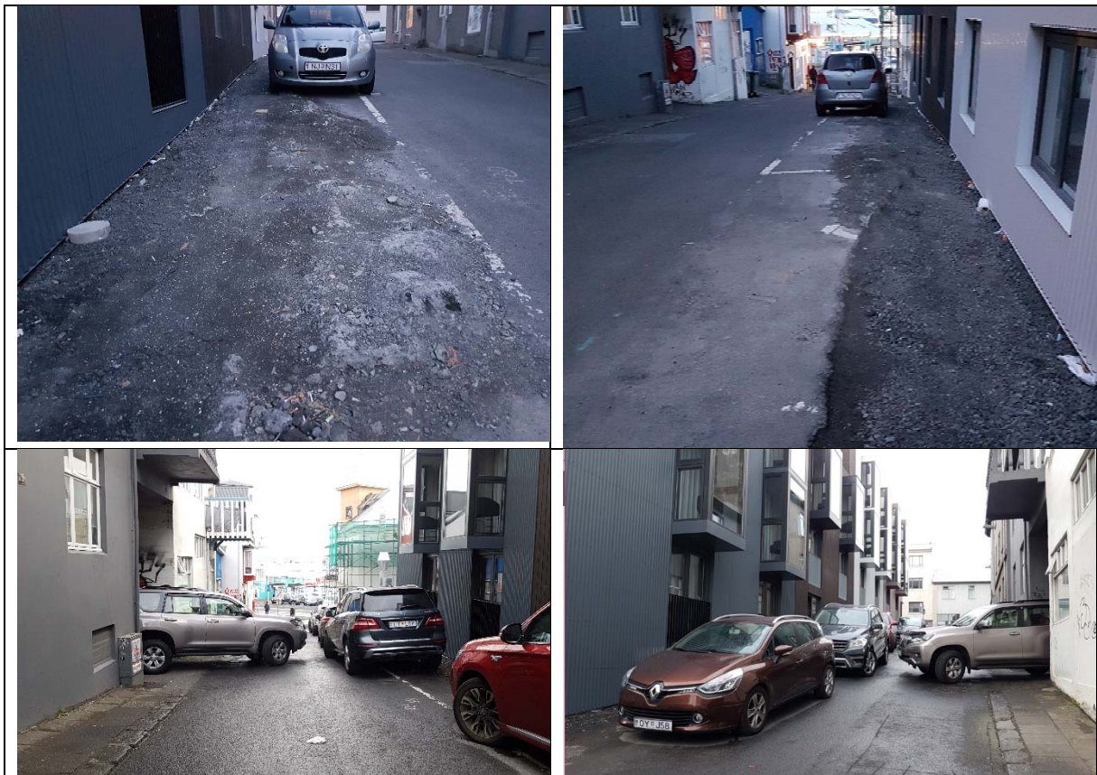
Mynd 2 Núverandi aðstæður á Norðurstíg. Ókutæki leggja inn á akstursleið. Illmögulegt er að aka inn og út úr porti og malarsvæði við húsin skapar fallhættu fyrir farþega á leið inn og úr bílum.