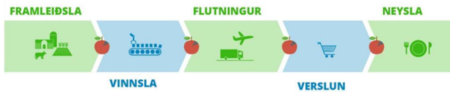
Mynd 1. Virðiskeðja matvæla.