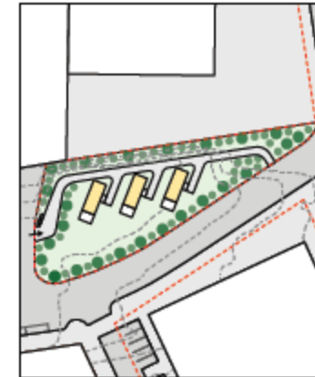
SKÝRINGARUPPRÁTTUR 1:1000 Slaga að tyrirkomulagi húsa