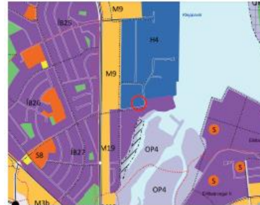
Úr Áðalskipulagi Reykjavíkur 2010-2030