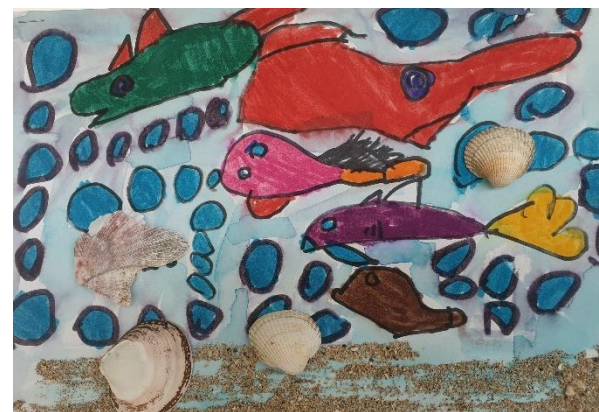
Sköpun eftir námskeiðið Hugrakkir krakkar.

Þegar lagt var af stað með verkefnið lögðum við mikla áherslu á skráningu, að hver ferð hefði markmið út frá Menntastefnu Reykjavíkurborgar sjálfsefningu, félagsfærni, heilbrigði, sköpun þó áherslan væri sérstaklega á læsi.