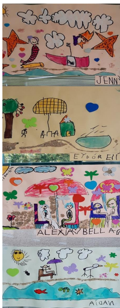
Sumarið á Lyngheimum.

Ábyrgðaraðili starfsáætlunarinnar 2019 - 2020.