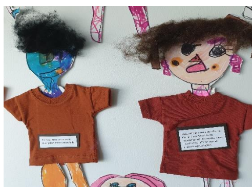
Unnið með vináttuna.