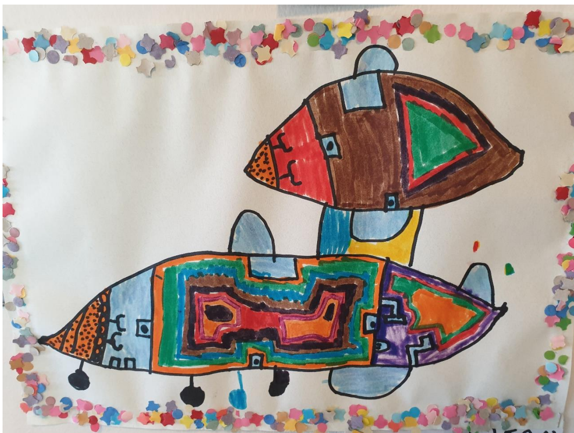
Mynd úr verkefninu Farartæki.