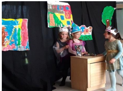
Leikritið leikið af hjartans list.