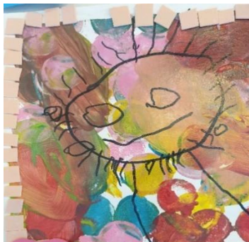
Ég sjálfur og skrímli.