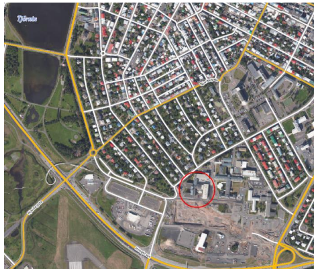
Mynd 1 - Staðsetning sjúkrahótels, barna- og kvennadeildar

Bönn og sérmerking stæða séu táknuð með viðeigandi skiltum og, þar sem við á, tilheyrandi undirmerkjum (sjá mynd á næstu síðu).