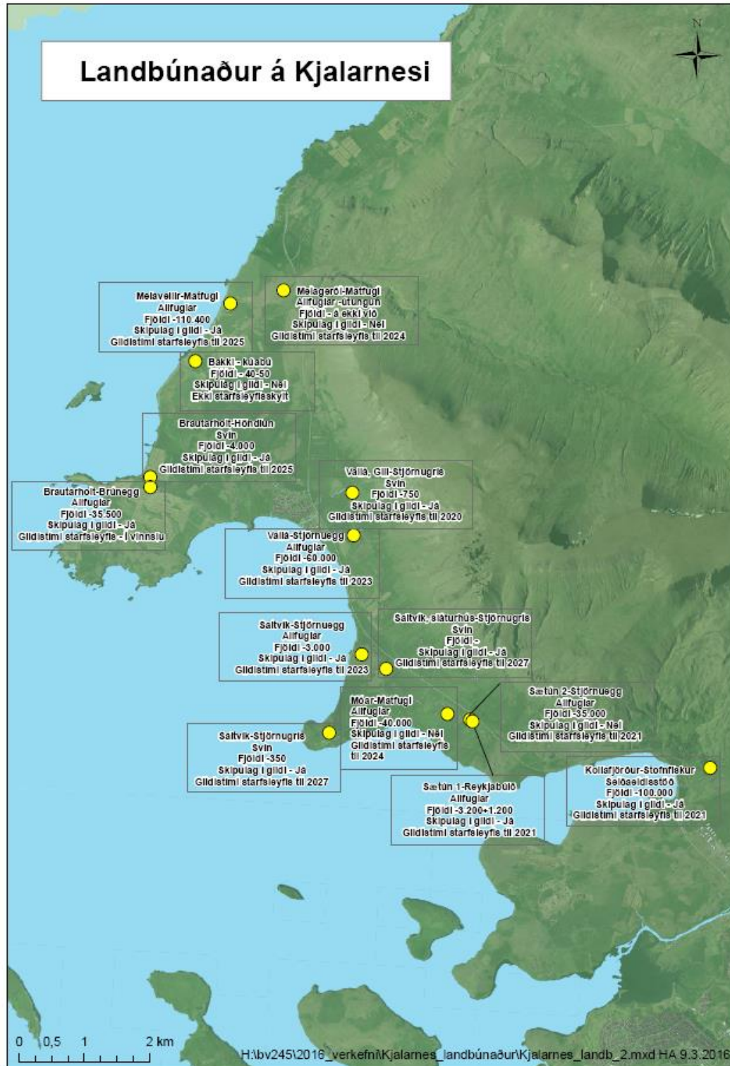
Staðsetning og fjöldi alifugla- og svinabúa á Kjalarnesinu. /eftir að uppfæra kortið.