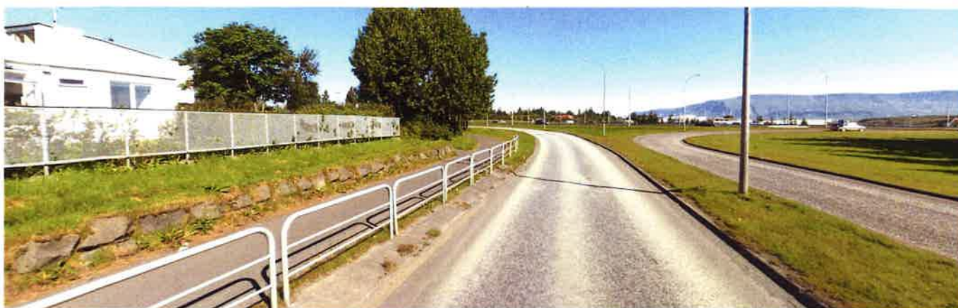
Mynd 3 Horft í norðvestur út stöð ca. 230 fyrir framkvæmdir