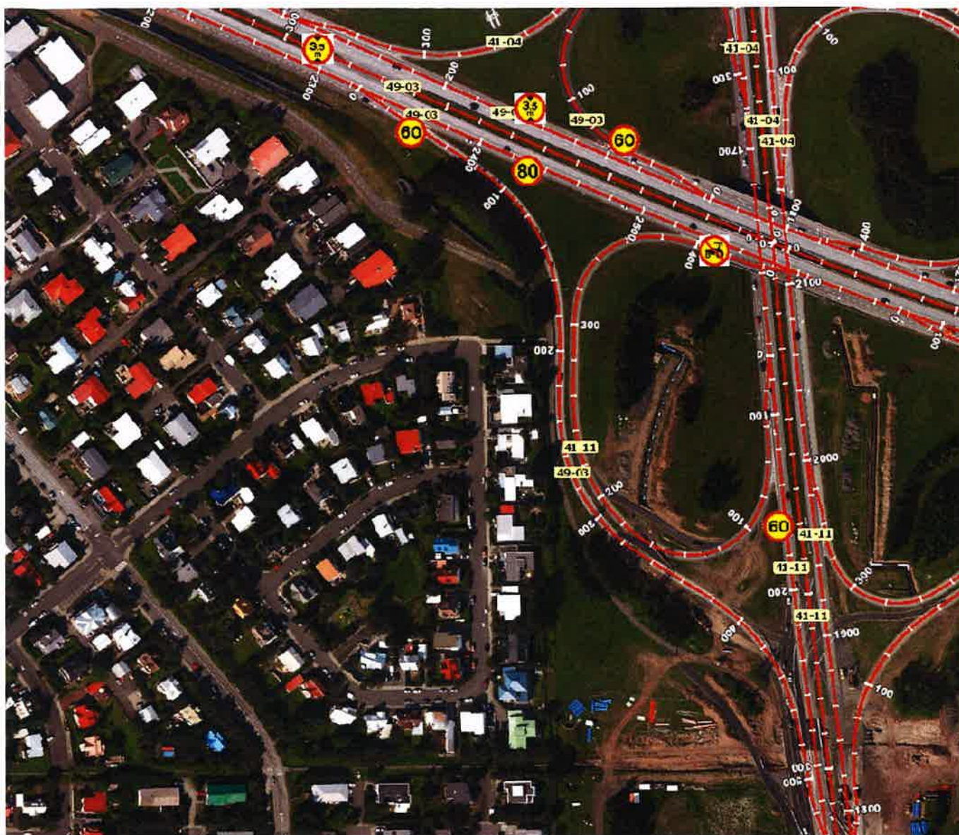
Mynd 1 Núverandi merkingar á svæðinu