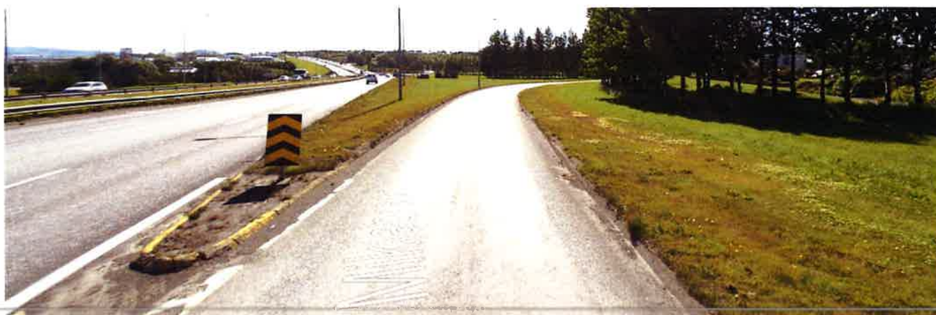
Mynd 2 Horft í austur eftir frárein úr stöð ca 40.