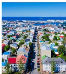
Starfshópur um mat á misferlisáhættu hjá Velferðarsviði