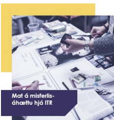
Mat á misferlisáhættu hjá ÍTR