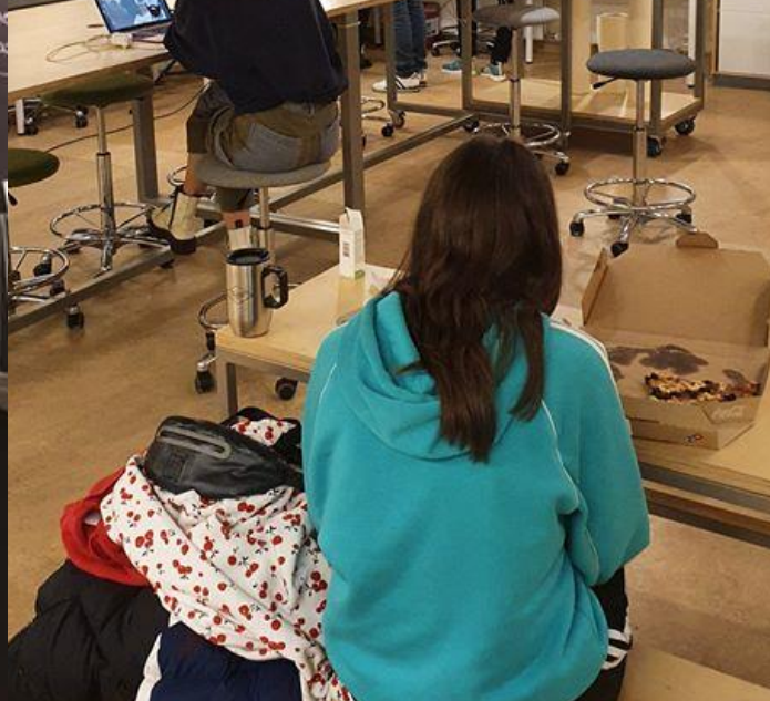
Gerð kynningarmyndabanda fyrir Tilraunaverkstæðið í Gerðubergi og Grófinni