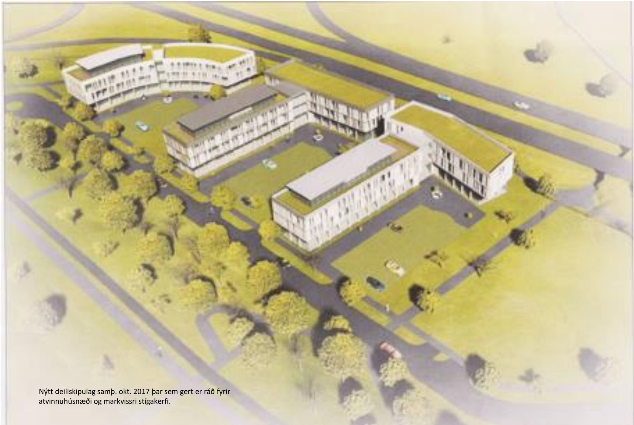
Nýtt deiliskipulag samþ. okt. 2017 þar sem gert er ráð fyrir atvinnuhúsnæði og markvissri stígakerfi.