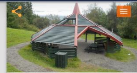
Skýli eða opinn skáli í Grundagerðisgarði