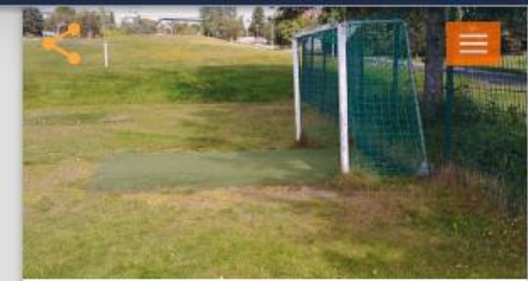
Endurbæta fótboldavöll milli K- og H-landa