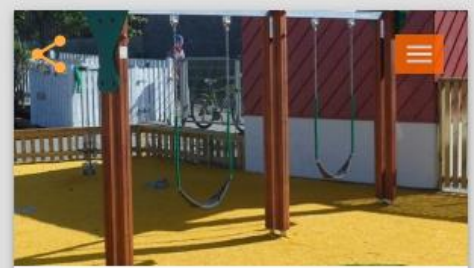
Rólur fyrir alla og hugleiðsla í Hólmgarði