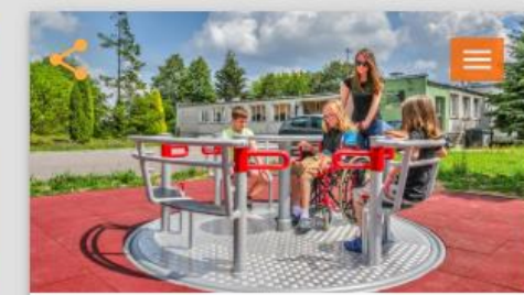
Hringekja með hjólastólaaðgengi