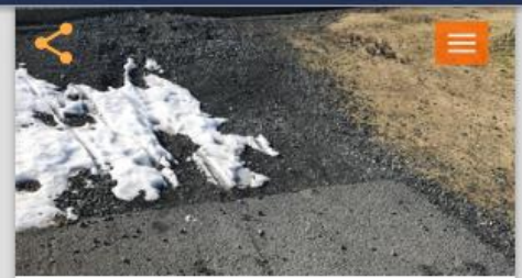
Klára göngustíg milli Síðumúla og Háaleitisbrautar

51 milljónir í boði Notaðu + til að velja hugmyndir