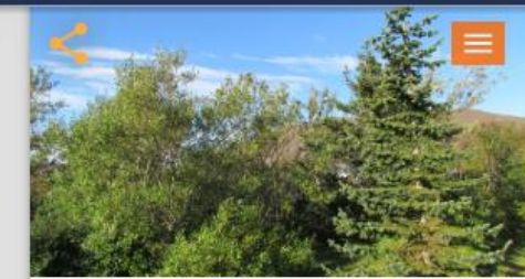
Gróðursetning meðfram Miklubrautinni