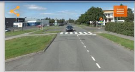
Bæta göngupverun við Háaleitisskóla - Álftamýri