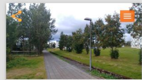
Lýsingu við göngustíg frá Listabraut upp að Austurveri