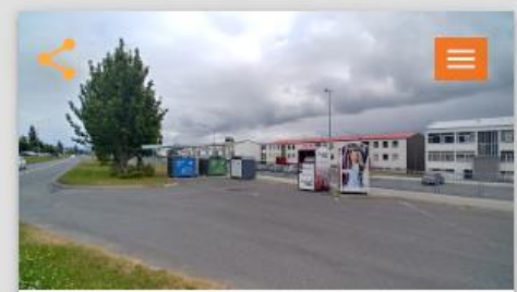
Bæta grendargáma við Grímsbæ