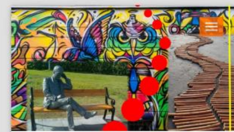
Meiri list í almannarýmið neðan við Miklubraut