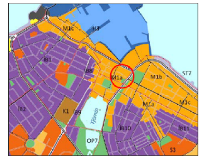
Hluti úr aðalskipulagi Reykjavíkur 2010-2030 - staðsetning breytingar.

Deiliskipulagsbreyting þessi sem fengið hefur meðferð í samræmi við ákvæði 1. mgr. 43. gr. skipulagslaga nr. 123/2010 var samþykkt í _____ 20__ og í _____ 20__.