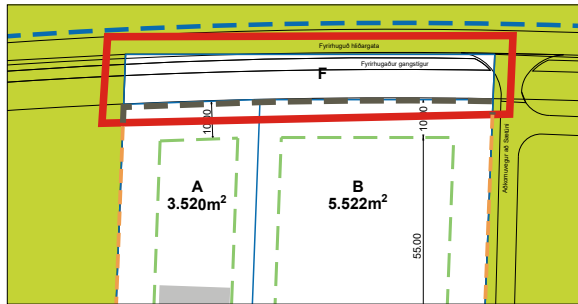
Tillaga að breyttri afmörkun Sætúns I, mkv. 1:2000